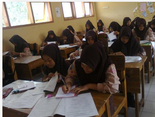
Gambar 5 Tertib dalam ulangan