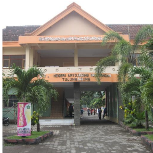
Gambar 4.1: MTs Negeri Aryojeding Tulungagung

MTs Negeri Aryojeding terletak di Jalan Raya Blitar Aryojeding Rejotangan Tulungagung. Berdiri pada tahun 1968 dengan waktu belajar dilaksanakan pada pagi hari, mulai jam 07.00-14.00 untuk kelas reguler dan 07.00-16.00 untuk kelas khusus.