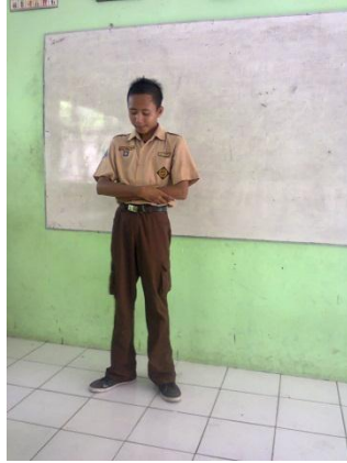
Gambar 3 Seorang siswa mendemonstrasikan shalat di depan kelas