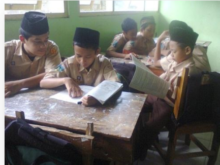
Gambar 2 Siswa saat menghafal bacaan shalat