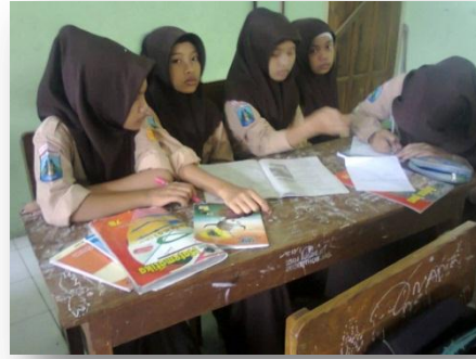
Gambar 1 Siswa sedang diskusi kelompok