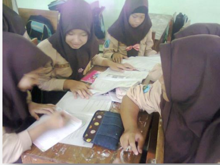
FOTO-FOTO SUASANA KELAS