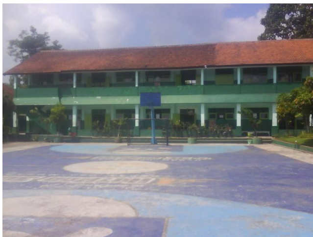
Gedung SMPN 22 Malang tampak dalam