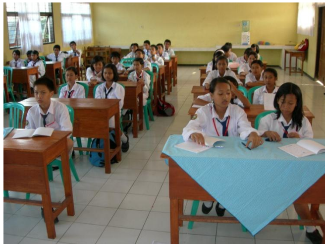
Kegiatan belajar mengajar siswa