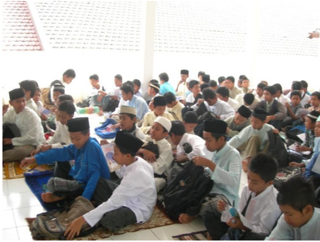
Kegiatan Peringatan Hari Besar Islam (PHBI) Maulid Nabi Muhammad SAW