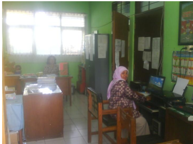
Kantor TU tampak dalam