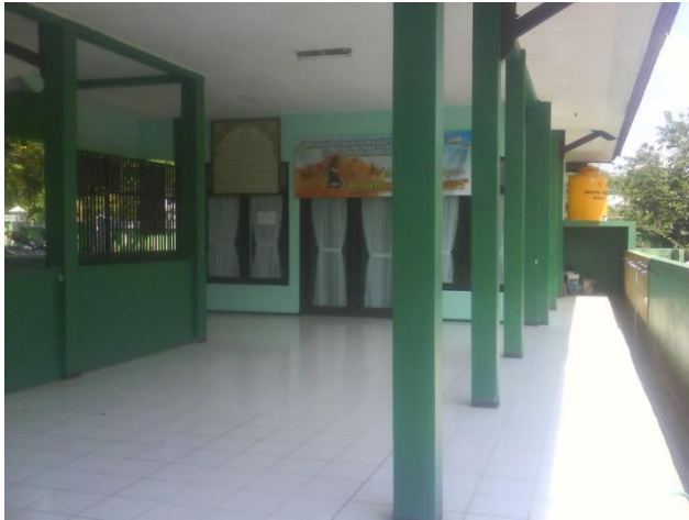
Masjid sekolah tempat kegiatan keagamaan