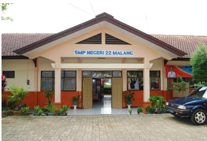
Kantor tampak dari depan