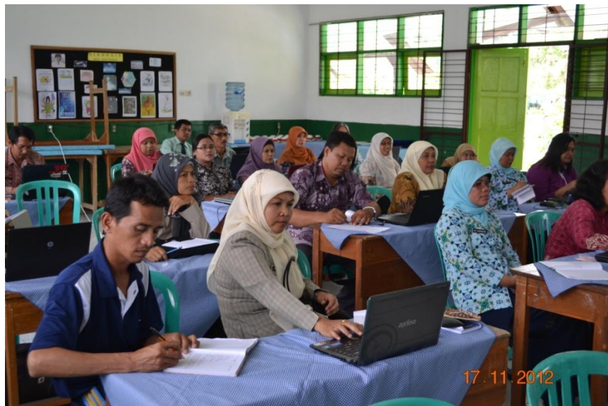
Dewan Guru Sedang Rapat Mingguan