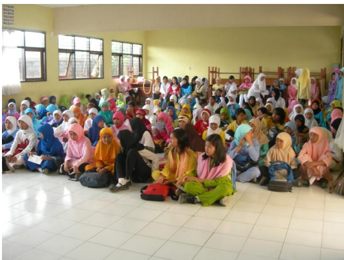
Kegiatan pondok Romadlon disekolah