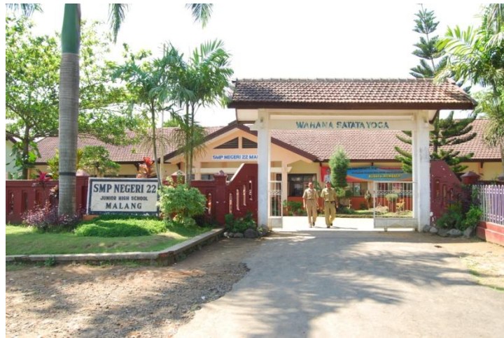
Pintu gerbang depan SMPN 22 Malang