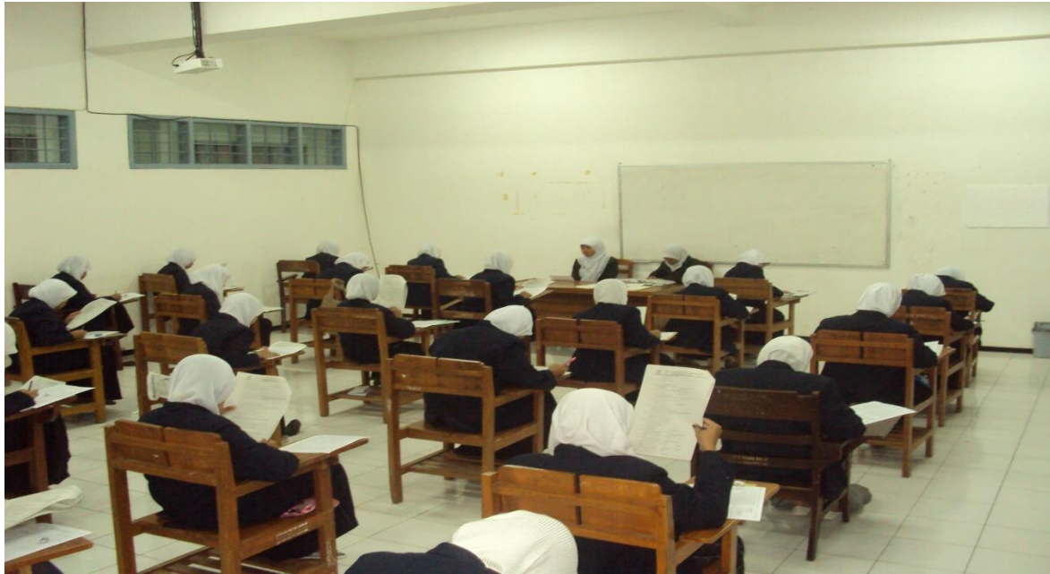
FOTO UJIAN TA'LIM AFKAR MA'HAD