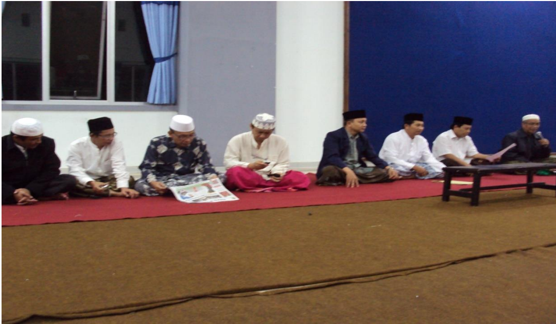
FOTO EVALUASI TA'LIM