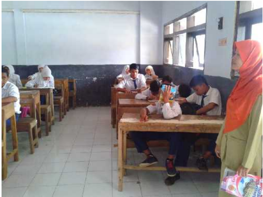
Gb.1 Kegiatan Belajar Mengajar