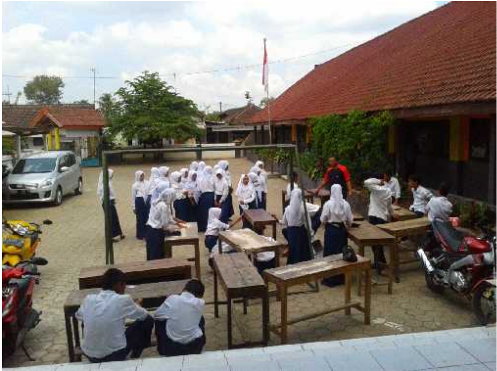
Gb. 5 Kegiatan Kerja Bakti antara Guru dan Siswa SMP Islam Jabung Kab.Malang