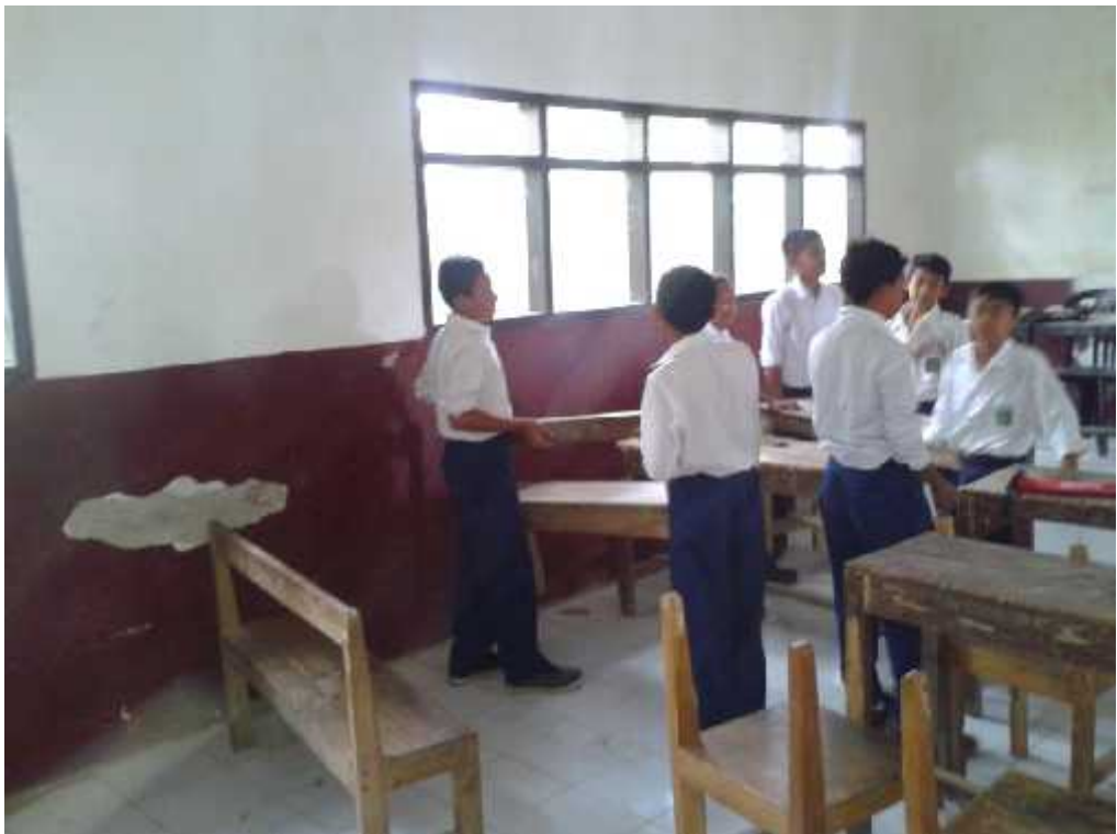
Gb. 6 Kegiatan Kerja Bakti siswa SMP Islam Jabung Kab. Malang dalam kelas