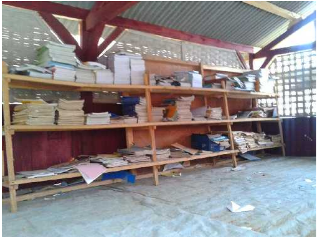
Gb. 9 Perpustakaan sementara SMP Islam Jabung Kab. Malang