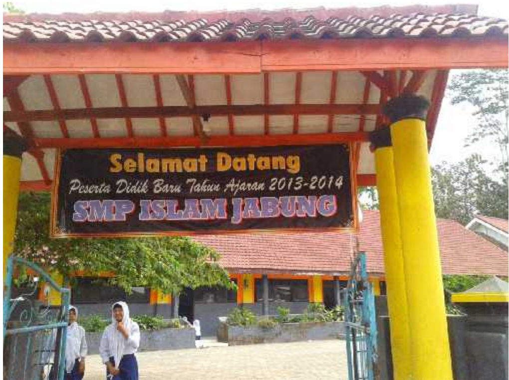
Gb.3 Gerbang SMP Islam Jabung Kab.Malang