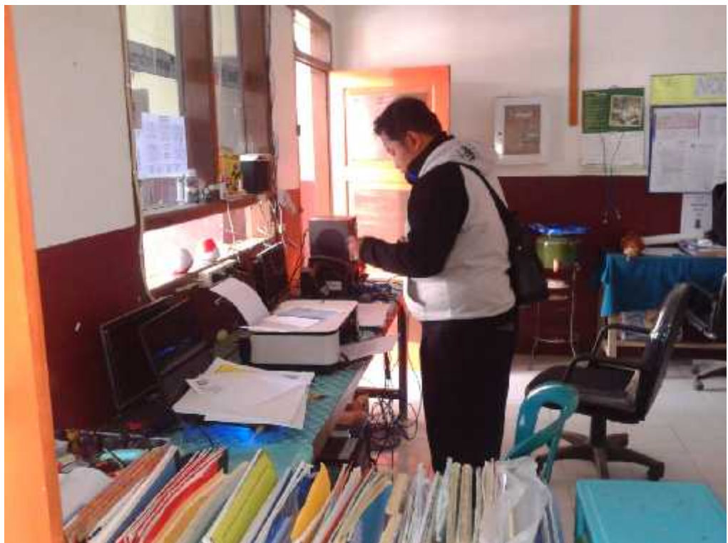
Gb. 10 Suasana kantor SMP Islam Jabung Kab. Malang