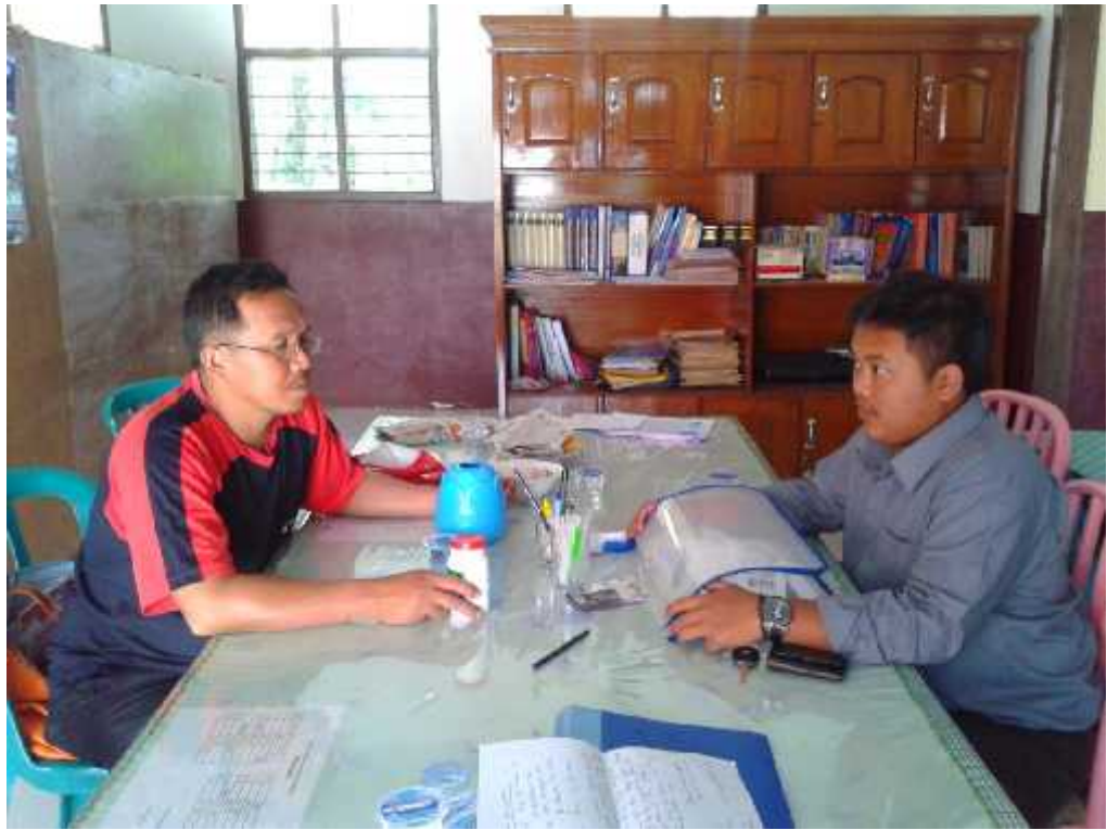
Gb. 7 Wawancara dengan Kepala Sekolah SMP Islam Jabung Kab. Malang