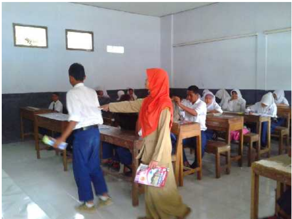
Gb.2 Kegiatan Belajar Mengajar