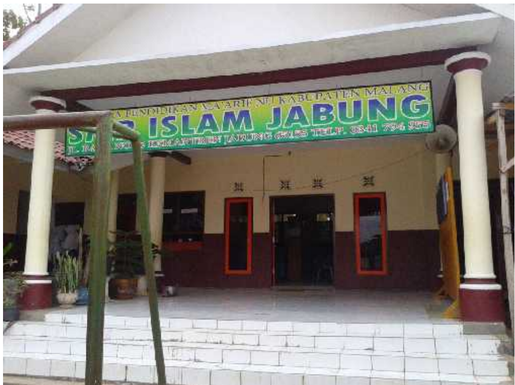
Gb. 4 Kantor SMP Islam Jabung Kab. Malang