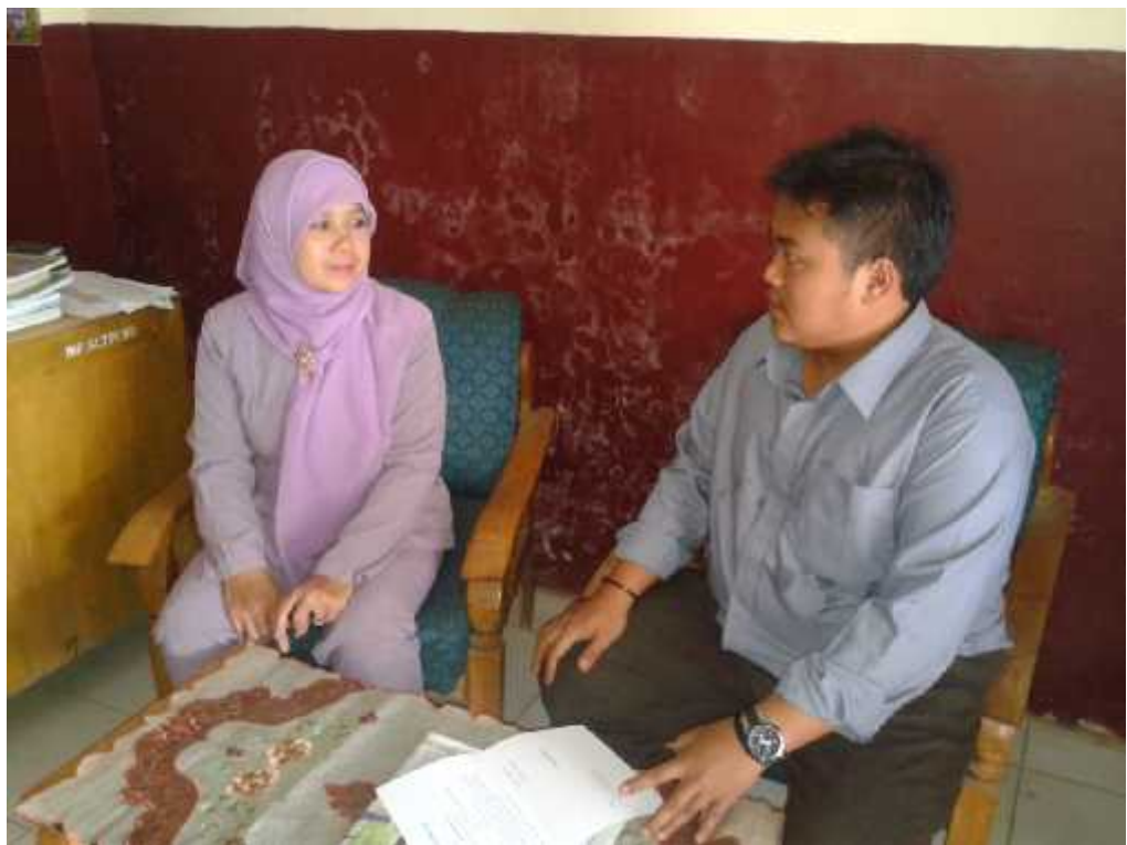
Gb. 8 Wawancara dengan salah satu Guru SMP Islam Jabung Kab.Malang