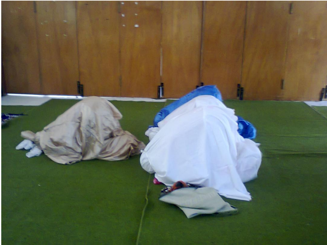
Tiga siswi sesama teman sebaya melaksanakan sholat ashar berjamaah di masjid sementara.