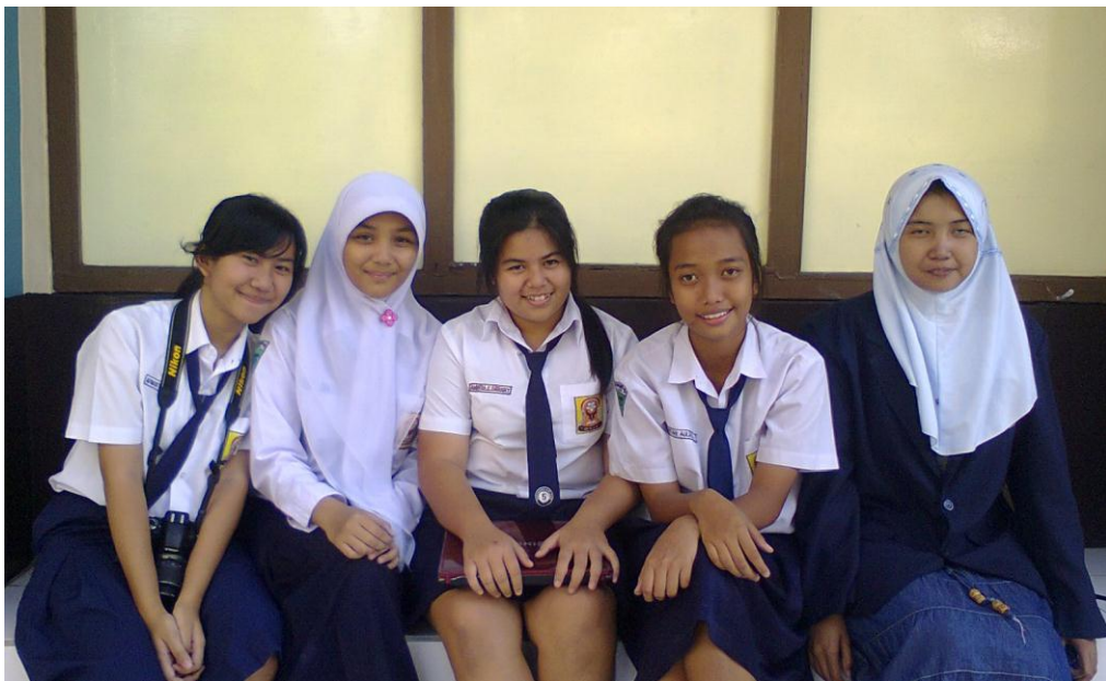
Peneliti bersama siswi kelas VIII RSBI, saat melakukan tugas kelompok di luar kelas. Terlihat keakraban sesama teman sebaya.