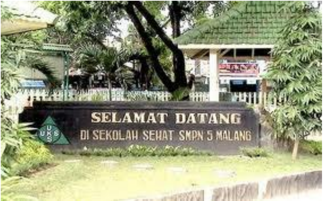
Bangunan fisik SMP Negeri 5 Malang, nampak dari depan.