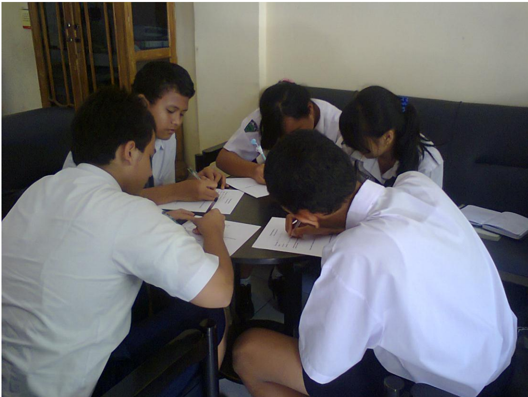
Lima siswa kelas VIII RSBI sesama teman sebaya mengerjakan tugas dengan kompaknya.