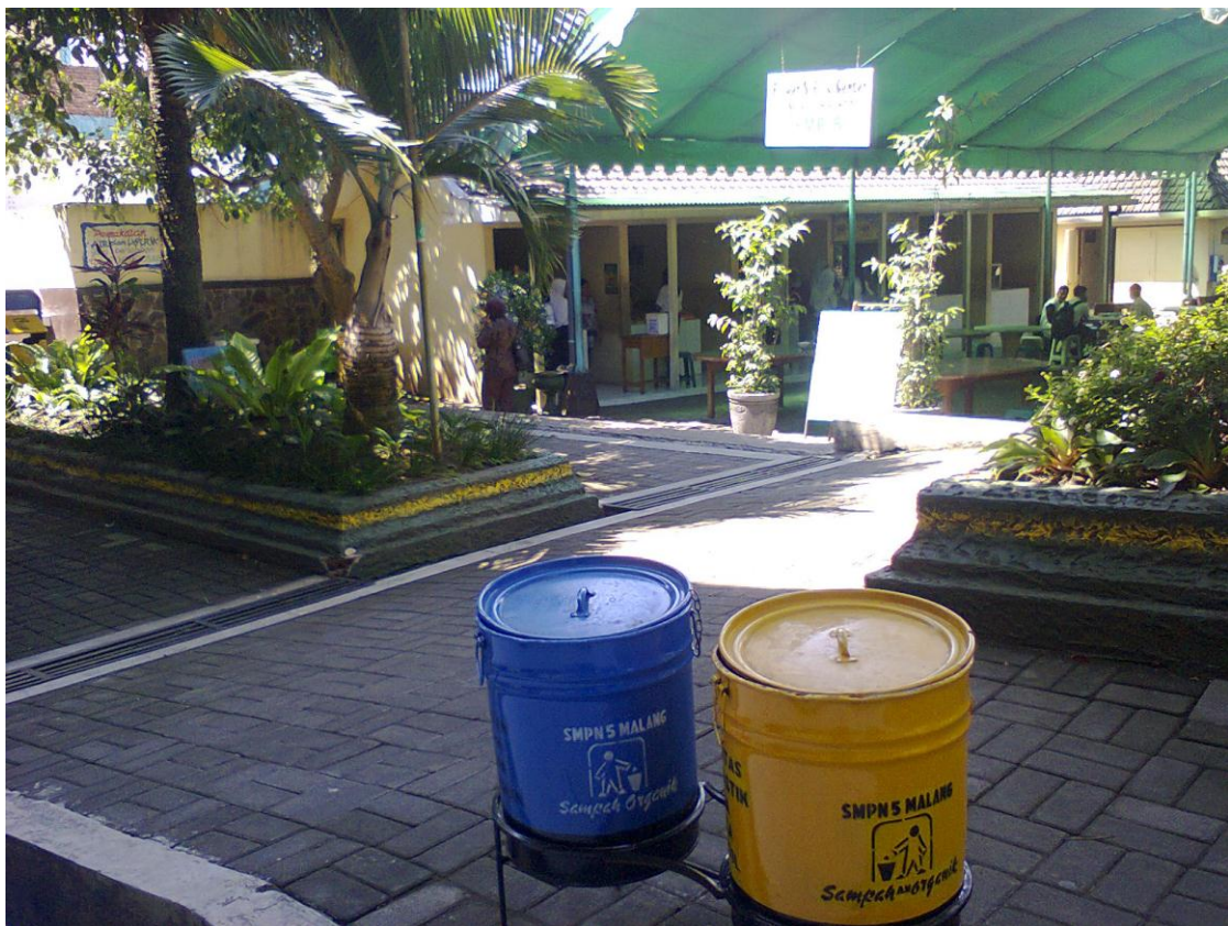
Lingkungan sekolah SMP Negeri 5 Malang, nampak bersih indah dan nyaman.