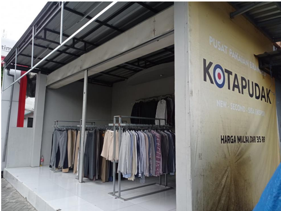
Gambar 2 store @Kotapudak2nd