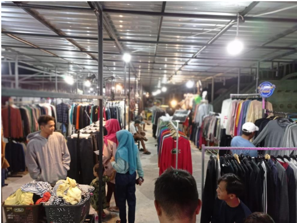
Gambar 4 event thrift pantura yang di ikuti @Bodoenk_Bekaselite pada tanggal 24-27 Februari 2022