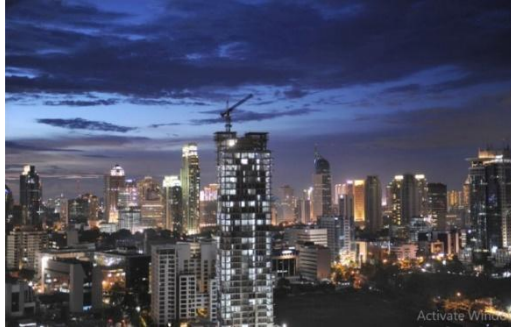
صورة الخبر ٣.