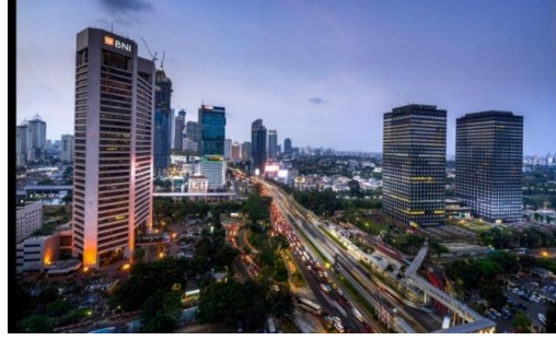
صورة الخبر ٤

العنصر الرسومي التالي بين قوسين، كما يلي: