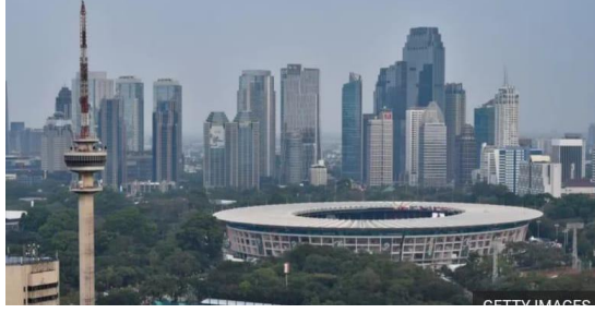
صورة الخبر ١ . على موقع بي بي سي

علاوة على ذلك، في الصورة أدناه كعنصر رسومي