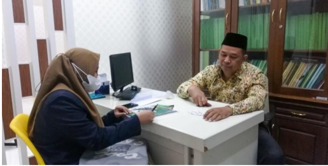
الصورة الثانية أنشطة المقابلة مع المحاضر في مادة النحو