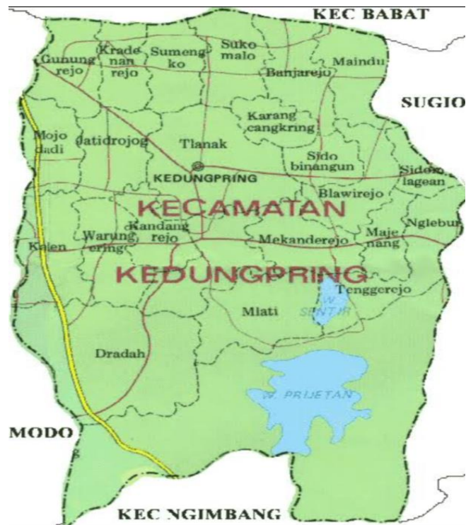
Gambar 1 Pemerintahan Desa Banjarejo

Tempat lokasi penelitian ada di Desa Banjarejo Kecamatan Kedungpring Kabupaten Lamongan, berikut ialah gambaran umum dari tempat penelitian.