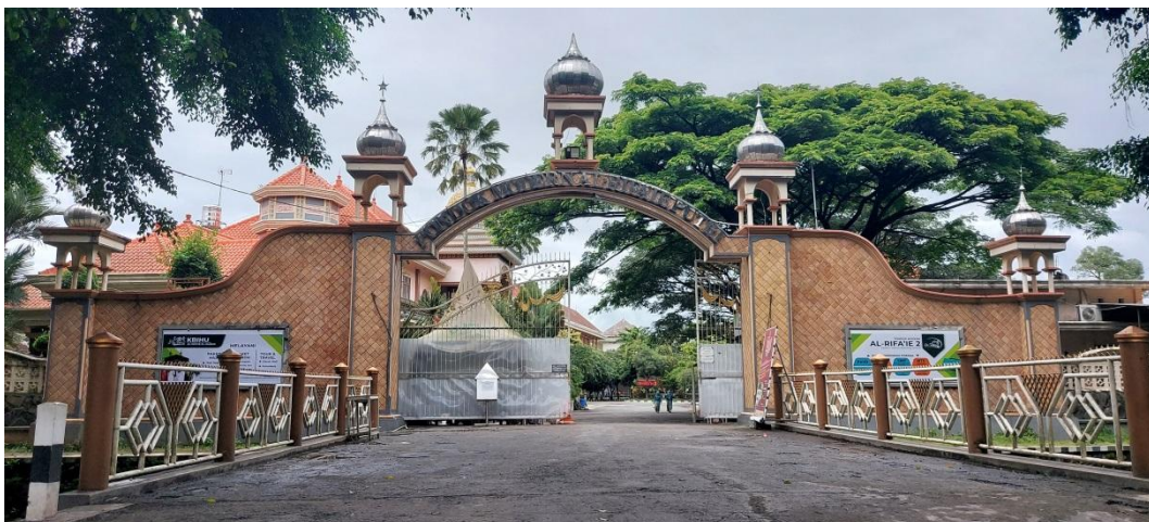
Pintu Gerbang dan Sekeliling depan Pondok Modern Al-Rifa'ie 2 Malang