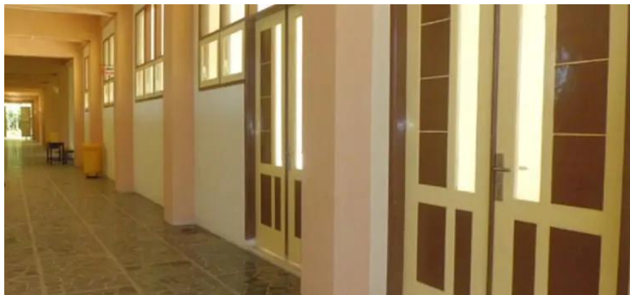
Kondisi bagian dalam Gedung Sekolah SMP Modern Al-Rifaie 2 Malang