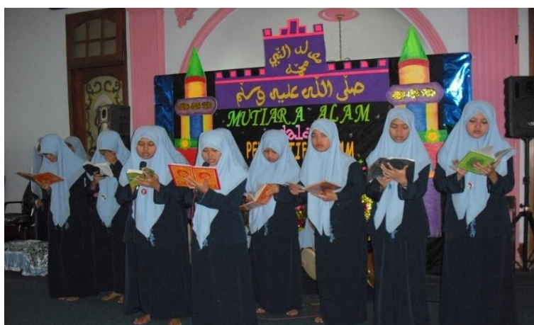
Gambar 4.6 Kegiatan Sholawat Diba'iyah Santri Pondok Modern Al-Rifa'ie 2