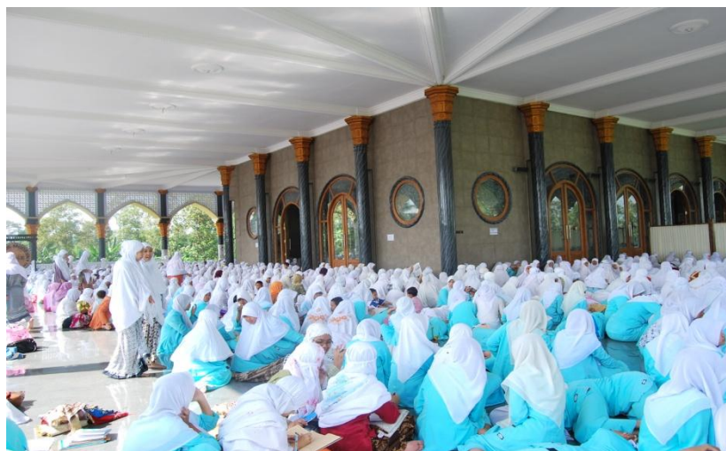
Gambar 4.3 Kegiatan Pendalaman Diniyah Santri Pondok Modern Al-Rifa'ie 2 Gondanglegi Malang

Selanjutnya, Pondok Pesantren Modern Al-Rifa'ie 2 Gondanglegi Malang mengaji kitab Ihya Ulumuddin, Tafsir Jalalain, Fathul Qorib, dan Kitab Ilmu Alat (Jurumiyah dan Imrity), Imriti, Kailani, Safinah, Tamyiz, Jurumiyah, Amsilatut Tasyrif, Aqidatula Awam, Ta'limul Muta Álim, Tijan Durori, dan lainnya serta kegiatan Jam'iyatul Qurro' Wal Huffadz (Seni Baca Al Qur'an dan Hafalan). Pada umumnya kitab kuning adalah kitab gundul, yaitu kitab yang tidak memakai harakat sehingga memerlukan penguasaan nahwu dan sharaf, serta bahasa Arab, untuk bisa membacanya.