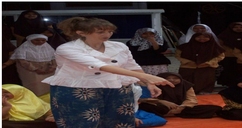
Gambar 4.4 Kegiatan Conversation Santri Pondok Modern Al-Rifa'ie 2 dengan Native Speaker

sama juga mendalami materi Pendidikan Agama Islam baik yang tertera dalam ketetapan kurikulum SMP maupun kurikulum kepesantrenan.