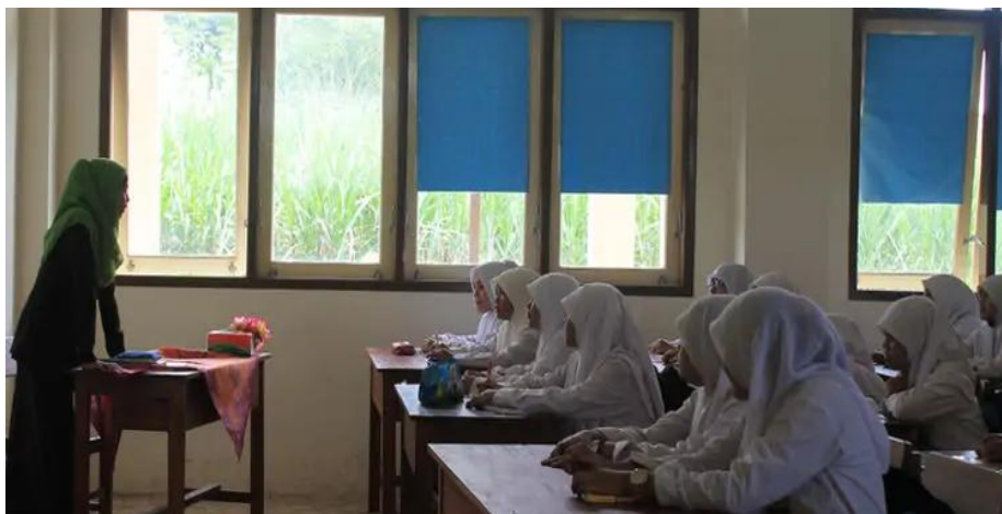
Suasana Kegiatan Belajar Mengajar Peserta Didik SMP Modern Al-Rifai'e 2 Gondanglegi Malang Malang di Kelas