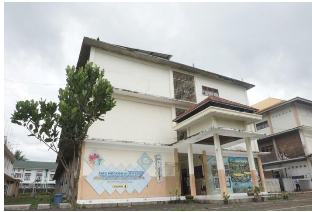
Gedung Sekolah Khusus Putra SMP Modern Al-Rifai'e 2 Gondanglegi Malang Malang