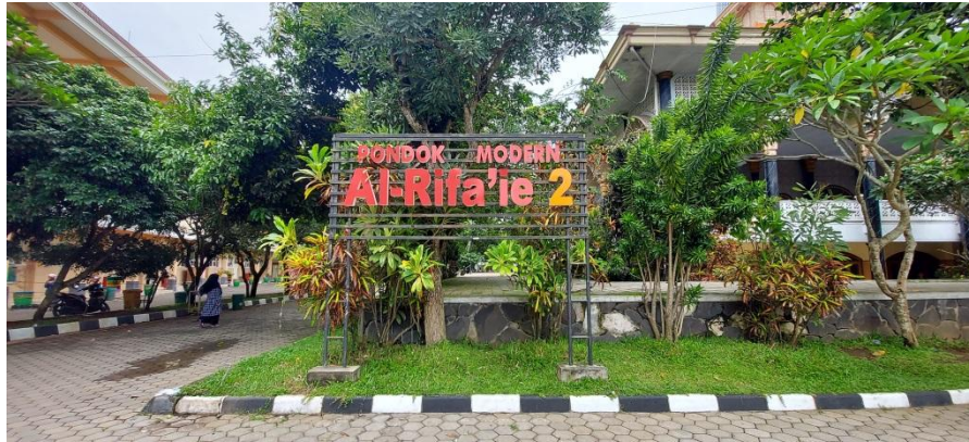
Kondisi Lingkungan Pondok Modern Al-Rifa'ie 2