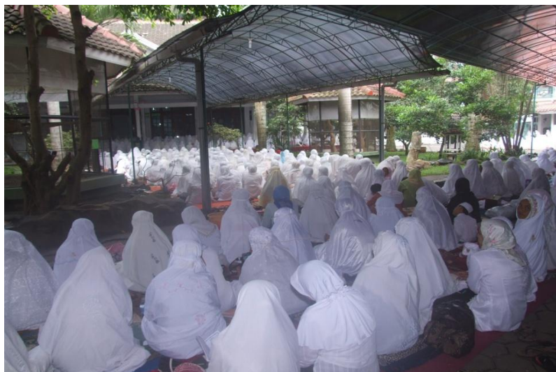
Gambar 4.8 Kegiatan Istighotsah Santri Pondok Pesantren Al-Rifa'ie 2

Terlihat dalam gambar di atas, suasana kegiatan Istighotsah yang dilaksanakan secara rutin di Pondok Pesantren Al-Rifa'ie 2 Gondanglegi Malang sebagai salah satu bentuk penciptaan tradisi spiritualitas ekspresi Pendidikan Agama Islam. Tentu hal ini akan sangat membantu karena aspek kelembagaan yang terintegrasi, dimana lebih memungkinkan dilaksanakan program-program serupa dengan mengoptimalkan waktu yang dimiliki selama di pesantren, sementara jika mengandalkan jam pelajaran di Sekolah tentu sangat menghadapi keterbatasan.