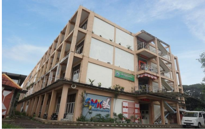
Gedung Sekolah Khusus Putri SMP Modern Al-Rifai'e 2 Gondanglegi Malang Malang