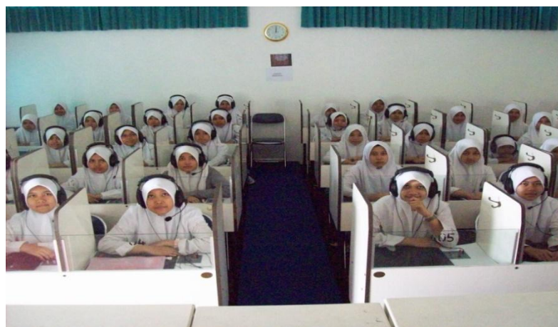
Gambar 4.5 Kegiatan Pendalaman bahasa Asing di Laboratorium Bahasa di Pondok Modern Al-Rifa'ie 2

SMP Al-Rifa'ie 2 sangat konsisten terhadap pelaksanaan kurikulum berbasis pesantren. Terbukti pelajaran-pelajaran yang biasanya di pesantren berada sangat sejajar pada jadwal pelajaran di SMP Al-Rifa'ie 2. Adapun proses kegiatan pelaksanaan pembelajaran di SMP Al-Rifa'ie 2 berbasis pesantren tidak jauh beda dengan pembelajaran pada umumnya diantaranya sebagai berikut: