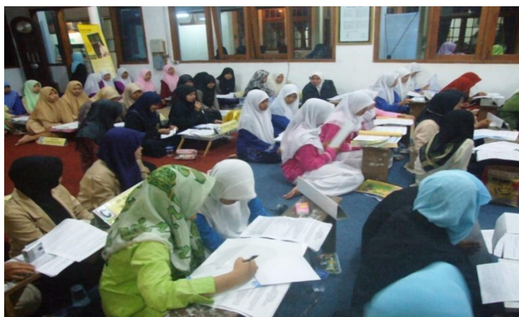
Gambar 4.7 Kegiatan Diniyah Santri Pondok Modern Al-Rifa'ie 2