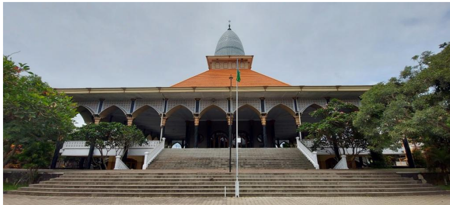
Masjid Pondok Modern Al-Rifa'ie 2 sebagai Pusat Kegiatan Beribadah dan Belajar Mengajar