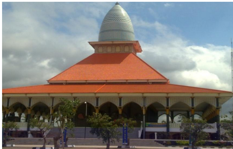
Gambar 4.2 Masjid Pondok Pesantren Al-Rifa'ie