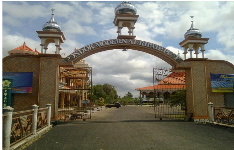
Gambar 4.1 Gerbang dan Halaman Depan Pondok Pesantren Al-Rifa'ie 2

Dapat diinformasikan, historika Pondok Pesantren Al-Rifa'ie 2 Gondanglegi Malang didirikan oleh KH. Achmad Zamachsyari pada 8 Oktober 1992 M / 11 Robiul Akhir 1413 H yang sengaja diorientasikan sejak awal pembangunannya untuk mewujudkan sitem pendidikan pondok pesantren yang lebih modern sebagai kebutuhan umat dan masyarakat ketika itu.