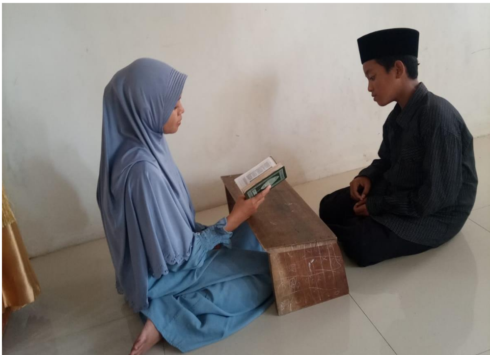
Gambar proses hafalan anak