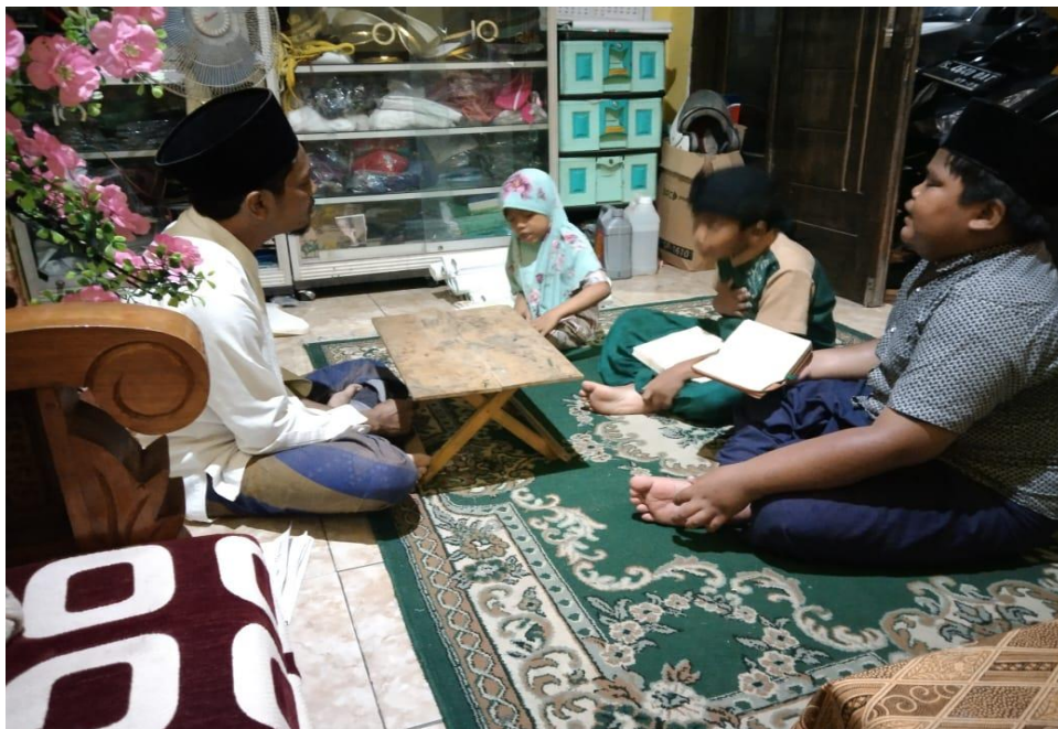
Gambar proses hafalan anak