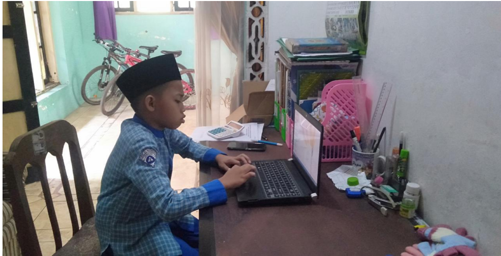
Gambar proses mengaji daring