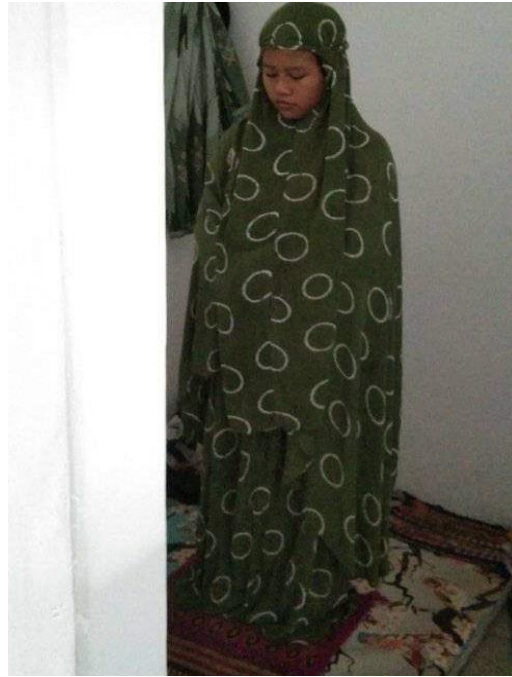
Gambar anak melakukan salat