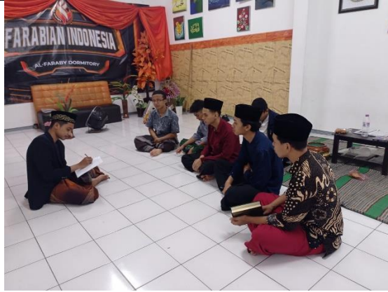
رسم توضيحي ٤ الصورة مع الطلاب في المعهد (طلاب من المبنى الفارابي)