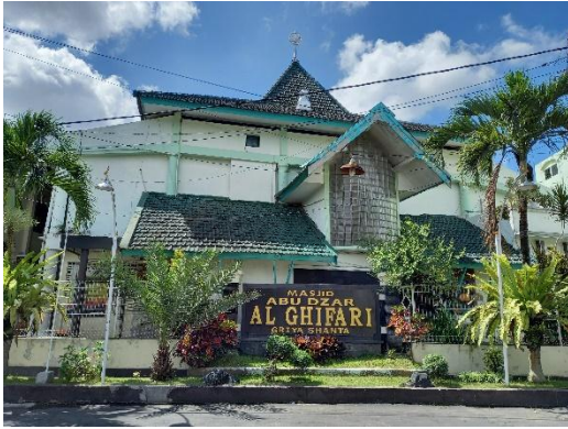
Masjid Abu Dzar Al-Ghifari