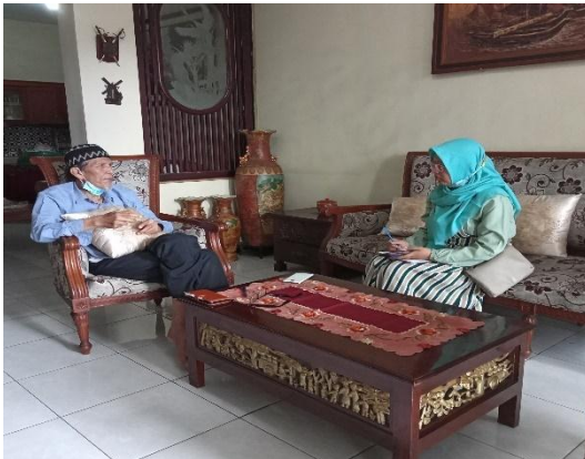
Ketua Ghifari Mart