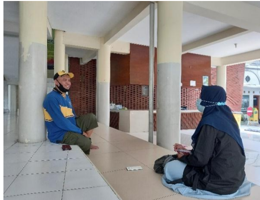
Ketua Bid. Muamalat