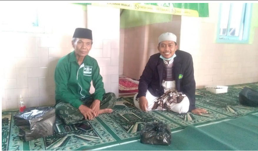
Bersama Tokoh Agama