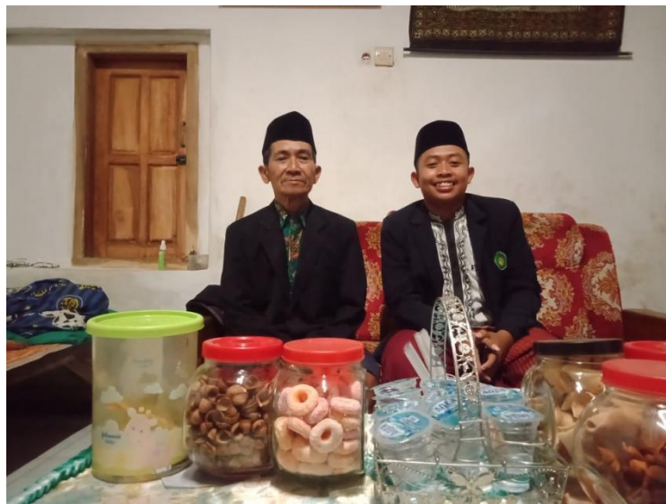
Bersama Tokoh Adat