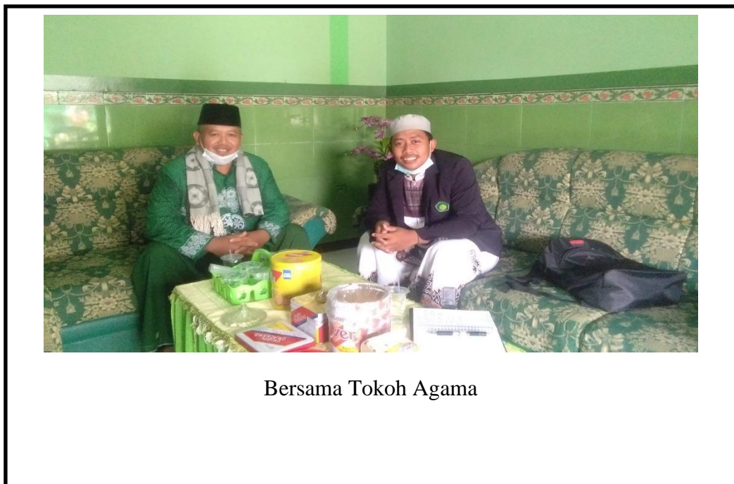
Bersama Tokoh Agama