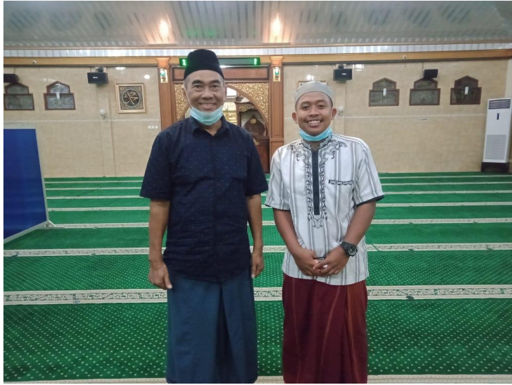
Bersama Tokoh Masyarakat