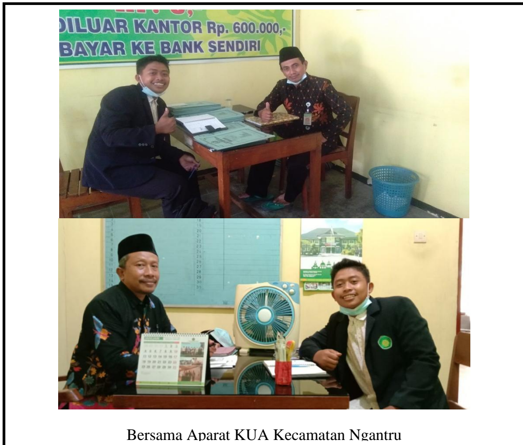
Bersama Aparat KUA Kecamatan Ngantru