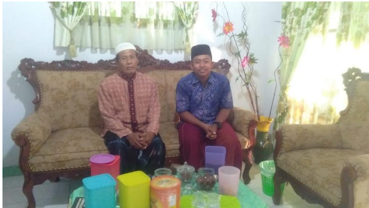
Bersama Tokoh Masyarakat