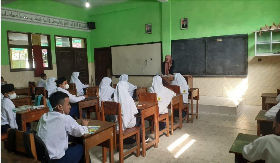
تعليم مهارة الكتابة في الفصل للمجموعة التجريبية