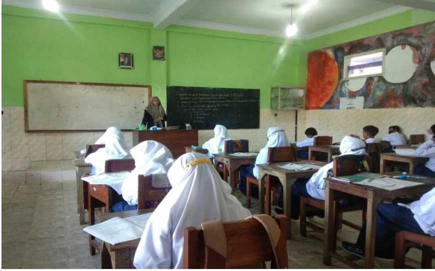
تعليم مهارة الكتابة في الفصل للمجموعة الضابطة