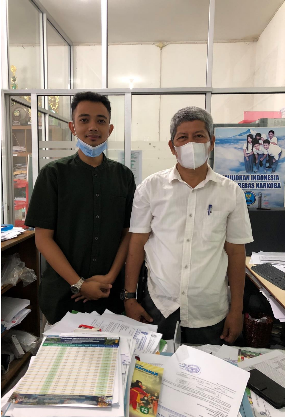
المقابلة مع نائب المدير لناحية منهج الدراسي