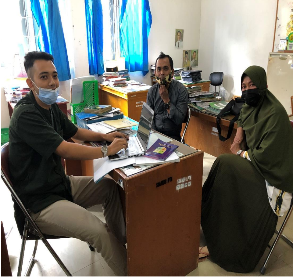
المقابلة مع المعلم اللغة العربية