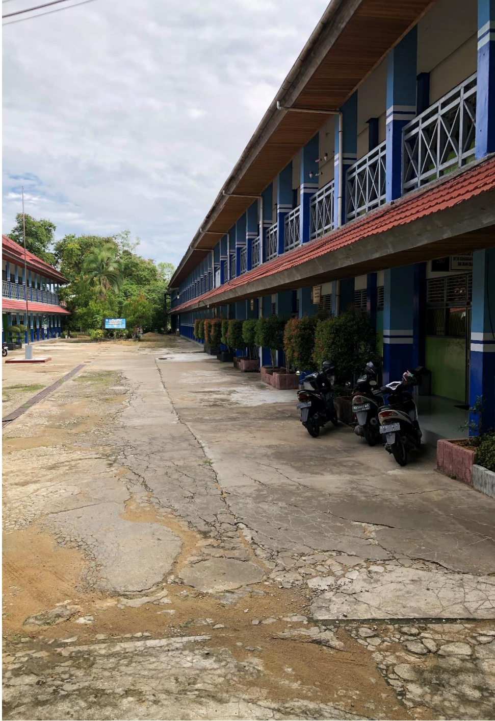
الملاحظة إلى مدرسة محمدية الثانوية الأولى بونتيناك