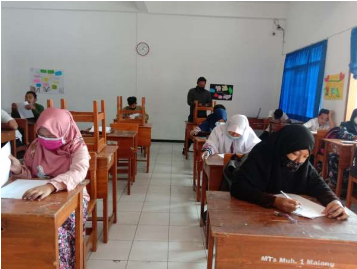
أنشطة الاختبار القبلي في المجموعة الضابطة (٨-د)