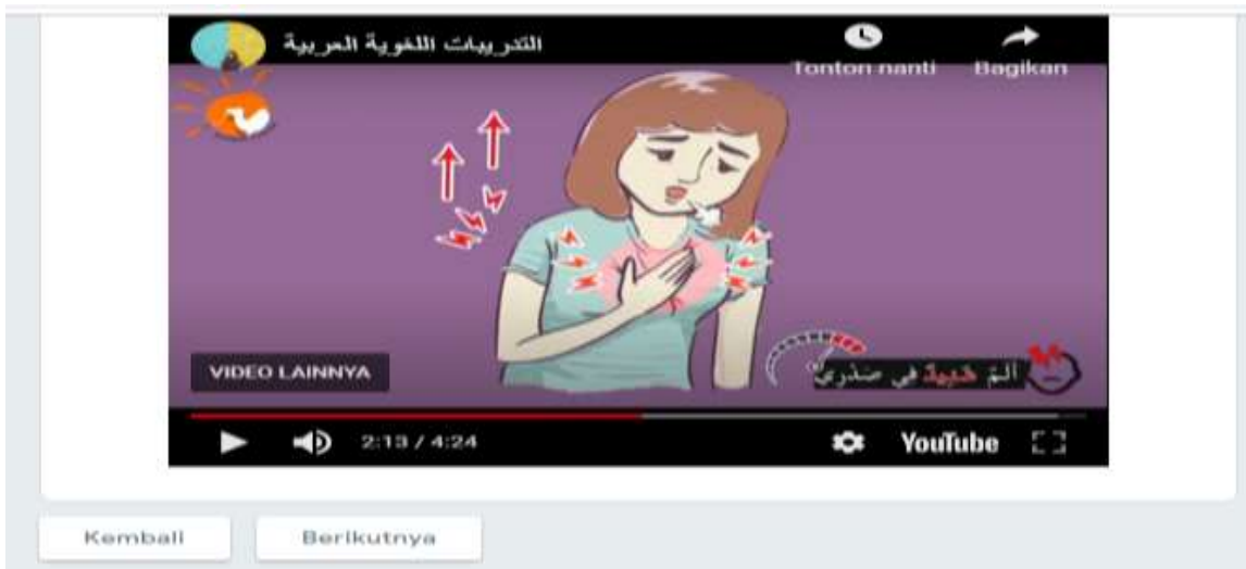
عرض الفيديو في Google Form