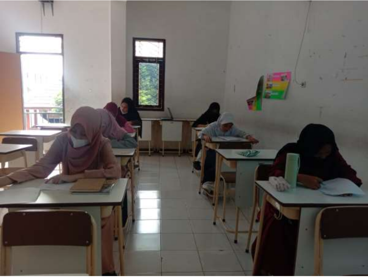
أنشطة الاختبار القبلي في مجموعة التجريبية (٨-أ)