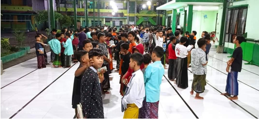
صورة الفائزين في مسابقة الخطابة العربية