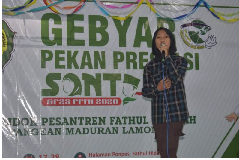
صورة نشاط الخطابة