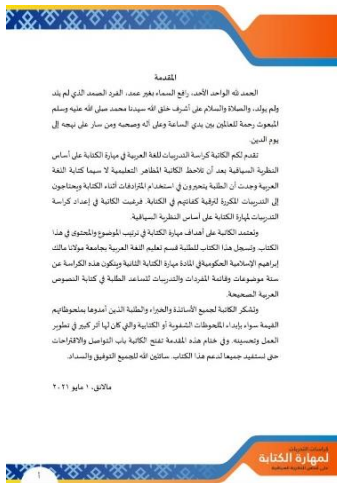
صورة ٥: مقدمة بعد التصحيح