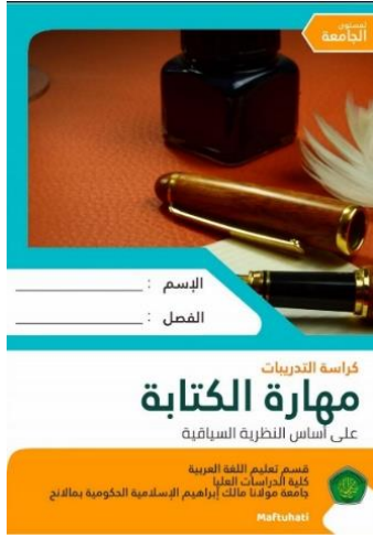
صورة ٣: الغلاف بعد التصحيح