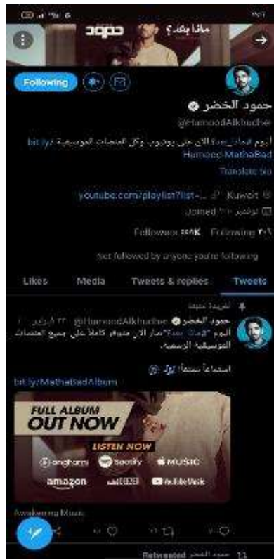
صورة ١ مظهر التويتر

موضوع يتحدث عنه كثير من المستخدمين في نفس الوقت.