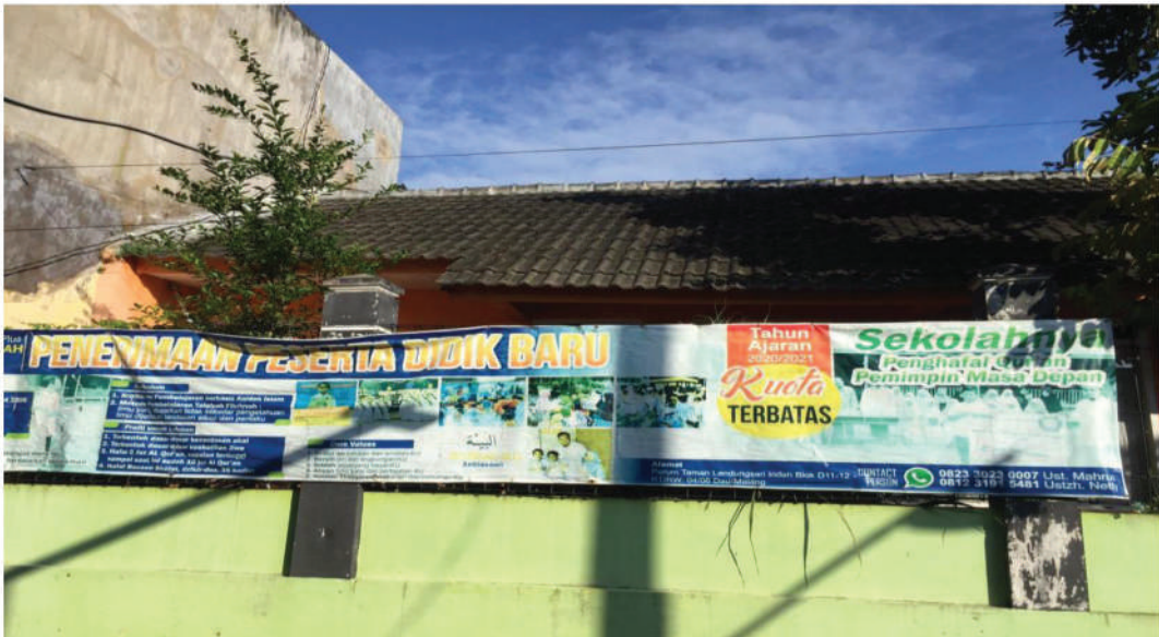
Sekolah Tahfiz Plus Khoiru Ummah Malang