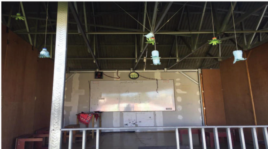
Ruang kelas Pembelajaran Sekolah Tahfizh Plus Khoiru Ummah Malang