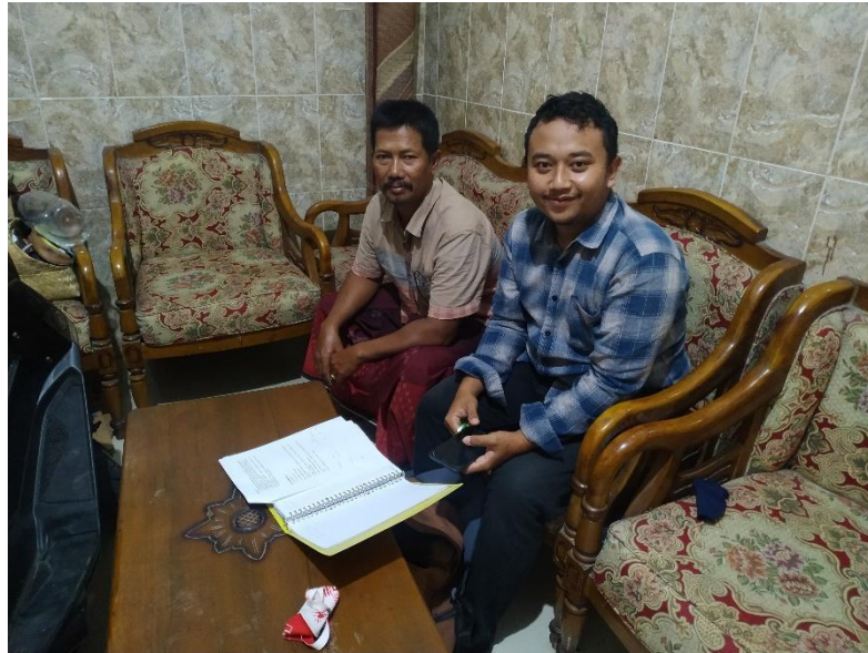
Wawancara dengan Bapak Ketua RT