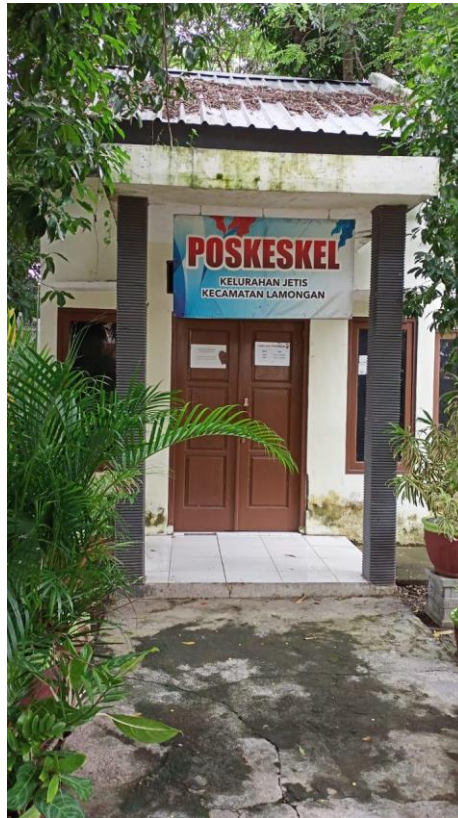
Pos Kesehatan Kelurahan Jetis