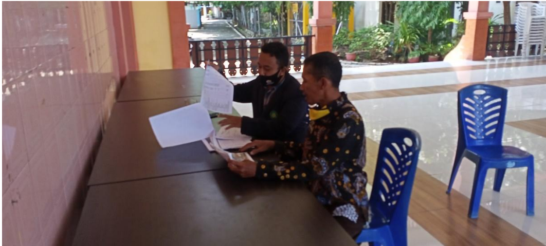
Wawancara dengan Bapak Sekretaris Kelurahan