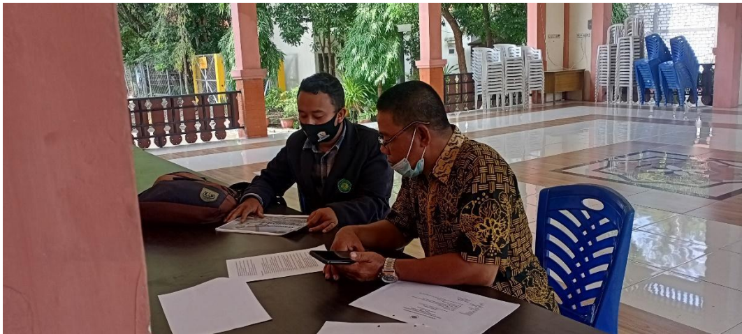
Wawancara dengan Bapak Bendahara Kelurahan