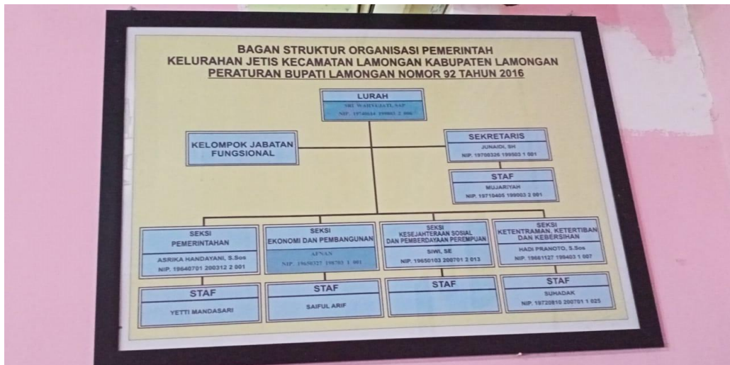
Gambar 4.1 Struktur Organisasi Pemerintah Kelurahan Jetis

Pada pasal selanjutnya, dijelaskan juga Tugas, Pokok, dan Fungsi (Tupoksi) dari masing-masing kedudukan jabatan di Pemerintah Kelurahan. Di dalam dokumen isian potensi Kelurahan jetis Tahun 2018 juga dicantumkan bahwa Kelurahan Jetis mempunyai beberapa Lembaga Kemasyarakatan, diantaranya yaitu :