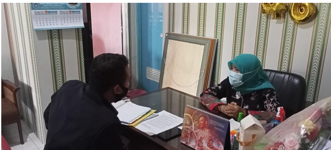
Wawancara dengan Ibu Lurah