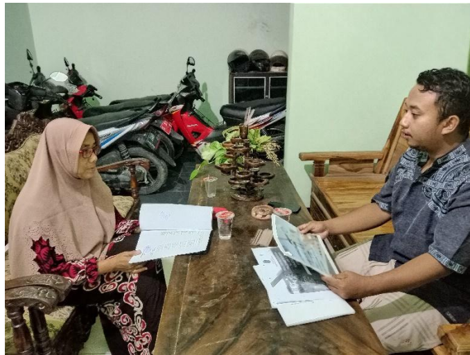
Wawancara dengan Ibu Ketua PKK