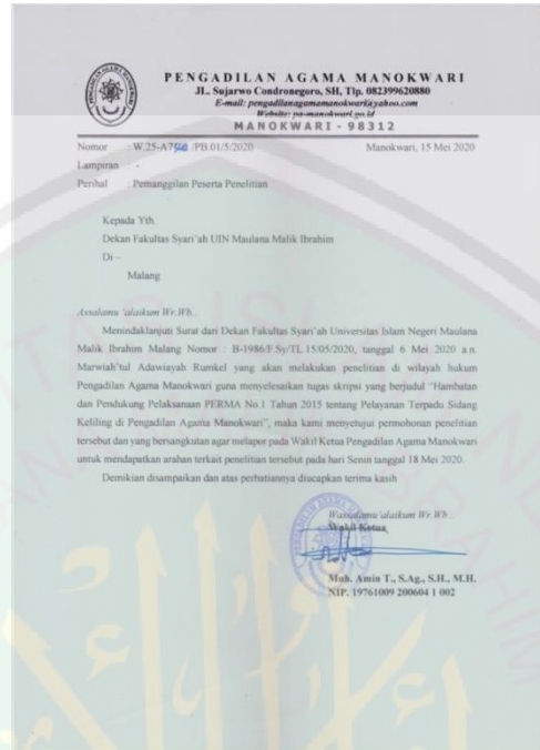
Gambar 1 Surat Balasan dari Pengadilan Agama Manokwari