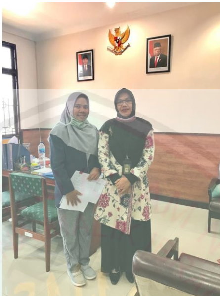
Gambar 3 Bersama Ketua Panitia Pengadilan Agama Manokwari