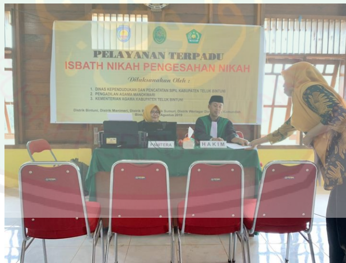
Gambar 6 Pelaksanaan Layanan Terpadu Tahun 2019