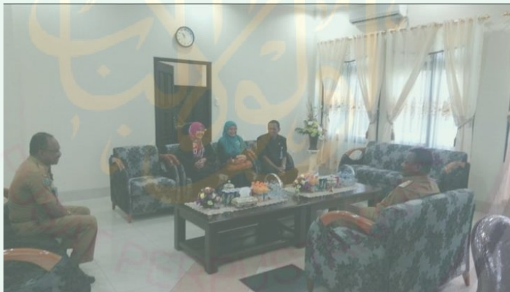
Gambar 4 Koordinasi antara Pengadilan Agama, Kemenag, Dukcapil, dan Bupati Teluk Bintuni