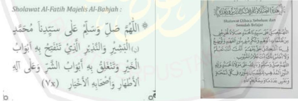
الصورة الأولى : دعاء قبل التعلم

أما داخل الفصل ، فكانت مراحل عملية التعلم والتعليم إجمالاً بدأت بقراءة الدعاء والتوسل إلى المشايخ قبل التعلم ، ثم بدأت المقدمة من المعلم وبدأت الأنشطة الأساسية وهو تقديم محتوى المادة الدراسية بعد ذلك. وفي الأخير سيكون هناك خلاصة من المعلم وأنشطة الأسئلة والأجوبة ثم دعاء الإختتام. ٨٩