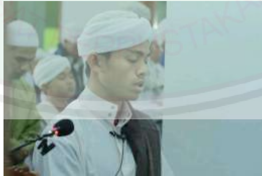
الصورة السابعة : تطبيق إمام صلاة الجماعة وهذا يكون في كل صلاة الفرض على