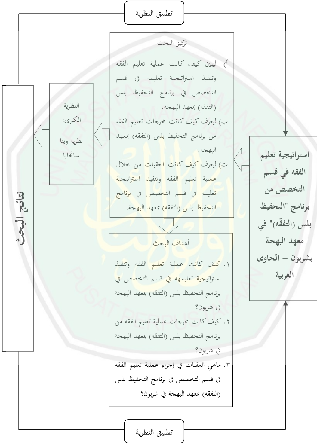
الرسم البياني : هيكلية تفكير البحث