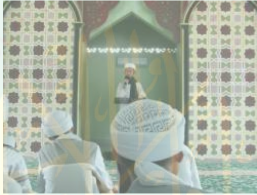
الصورة السادسة : تطبيق الخطبة