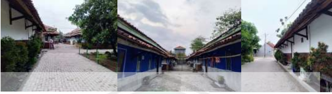
الصورة الخامسة عشر : بعض الفصول الدراسية الموجودة في المعهد