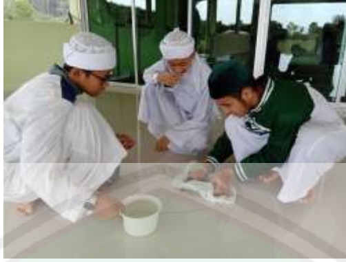
الصورة الخامسة : تطبيق تطهير النجاسة