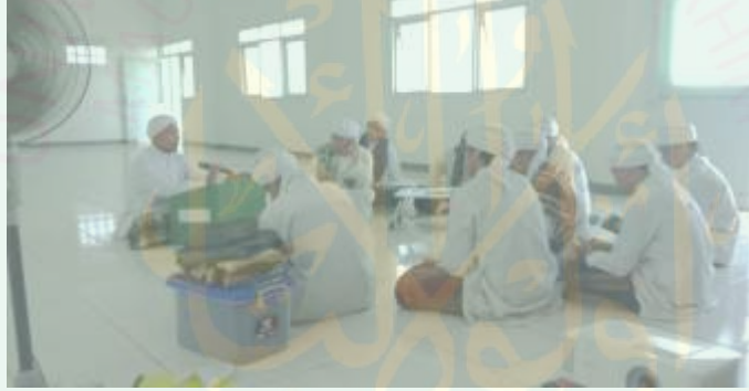
الصورة الرابعة : مناقشة المسائل بين الطلاب

"فالطلاب الذين عليهم مهمة سيقدمون نتائج وظائفهم في الفصل ثم سيتناقش الطلاب عن تلك المسائل. طبعاً ، كانت المسائل التي أعطيتها للطلاب كالمسائل المعاصرة التي كانت النظرية لتحليلها موجودة في الكتب وعليهم تحليلها حسب النظرية الموجودة. وفي الأخير سأعطيهم ملاحظات." ١٠٣