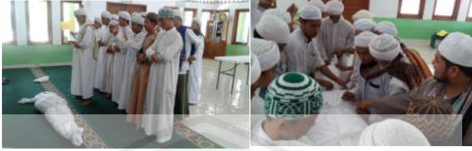
الصورة الثامنة : تطبيق الرعاية بأمور الجنائز