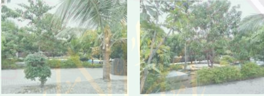
الصورة السادسة عشر : حديقة في أثناء مبنى المعهد

ثم بالنسبة إلى البيئة ، كما كانت عادة سائر المعاهد أنّ الطلاب يسكنون ويتعلمون في مبنى المعهد. فلذلك حصر الباحث على بية المعهد فقط. فكان البيئة الإجتماعية في هذا المعهد جيدة جداً سواء داخل الفصل الدراسي أو خارجه. وأنّ فيها ممتلئة بالثقافة الإسلامية. فكانت المعاشرة بين الطلاب بين بعضهم البعض أو بين