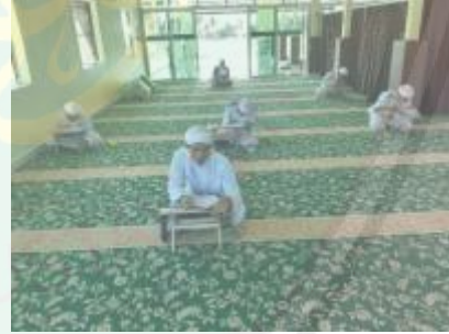
الصورة الحادية عشر : الإمتحان التحريري.