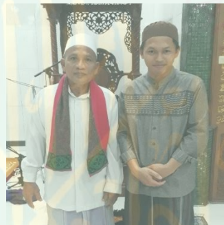
Tokoh Agama Desa Karangrejo