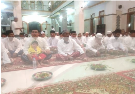
Maulid Nabi Muhammad Saw.