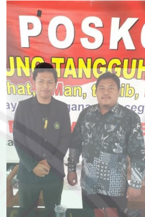
Kepala Desa Karangrejo