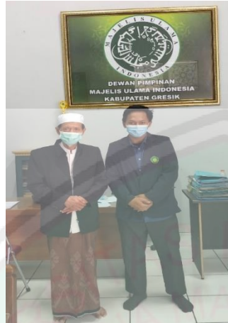
Ketua MUI Kabupaten Gresik