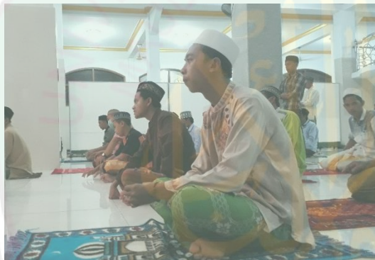
Shalat Jamaah di Masjid