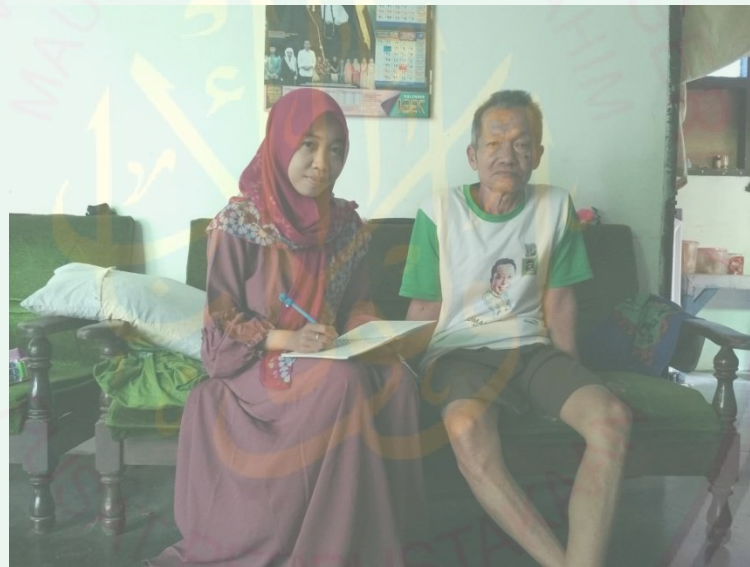
Wawancara bersama mbah suba'i