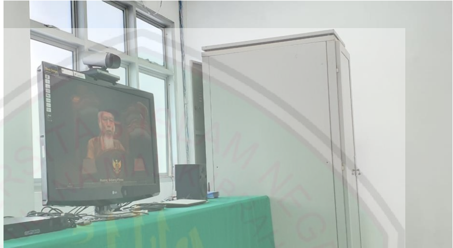
1.1. Media transisi Video Conference .