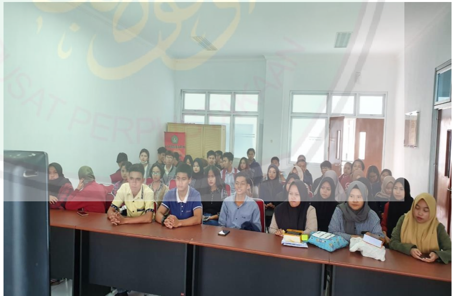
1.2. Peserta yang mengahidr persidangan jarak jauh.