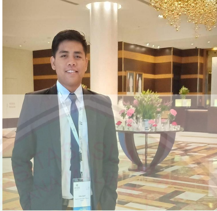
صورة ٦ : مندوبة مناظر قطر ٢٠١٩