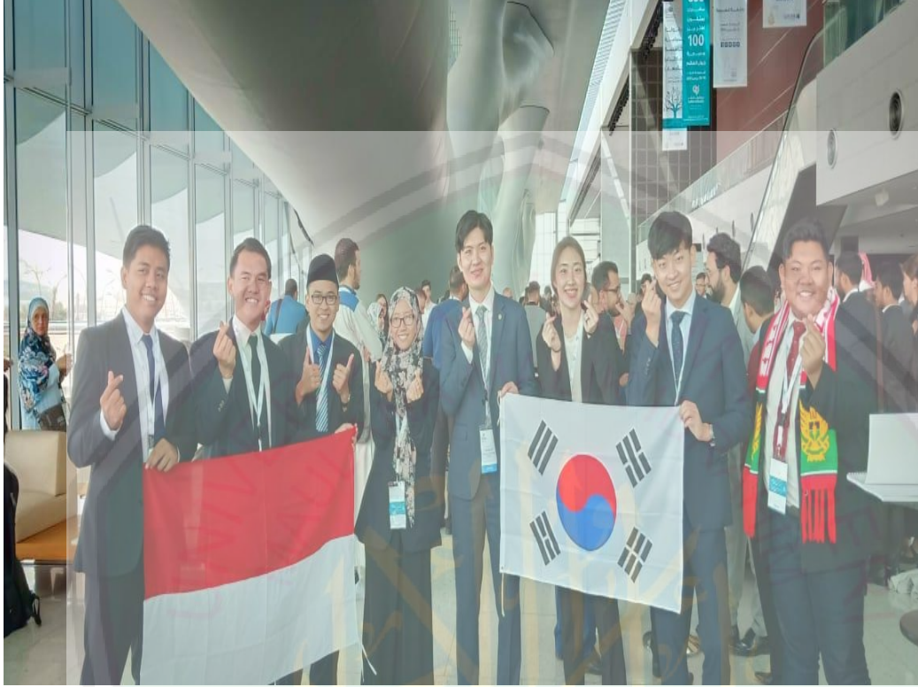
صورة ٥ : مندوبة مناظرة قطر ٢٠١٩ من إندونيسيا وكوريا