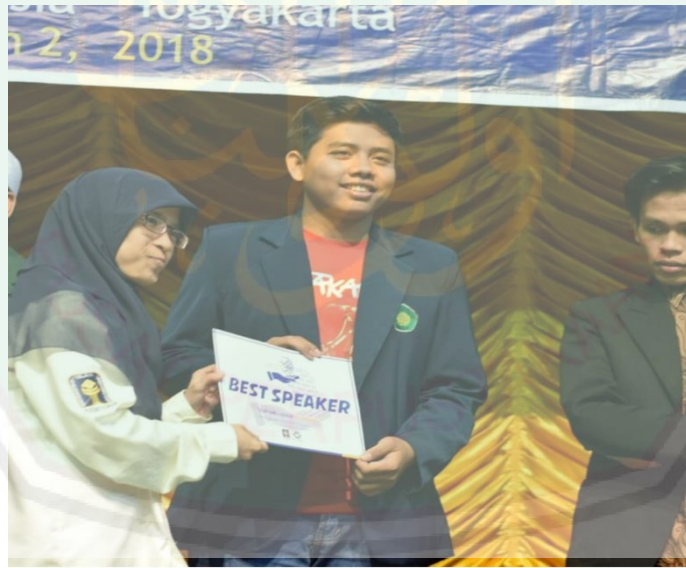
صورة ٤ : أفضل متحدث