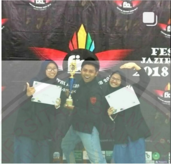
صورة ٣ : فرقة الفائزة في مسابقة مناظرة الوطني