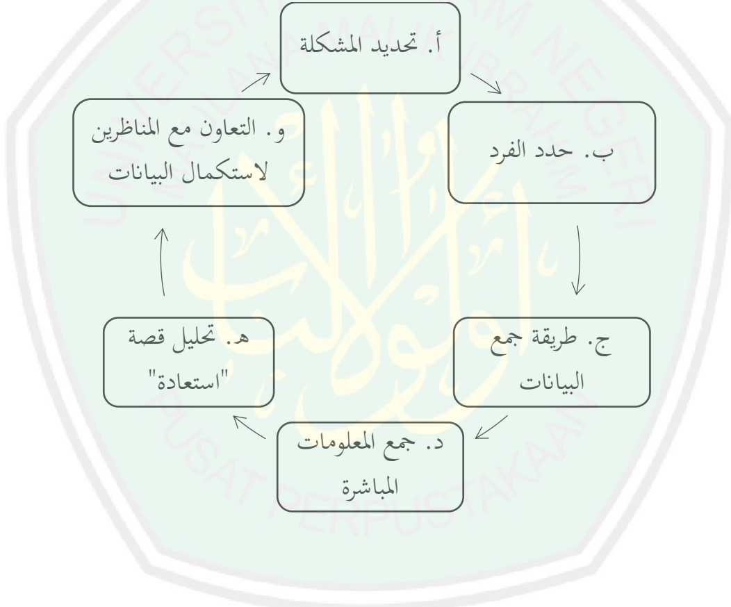
الجدوال : ٢