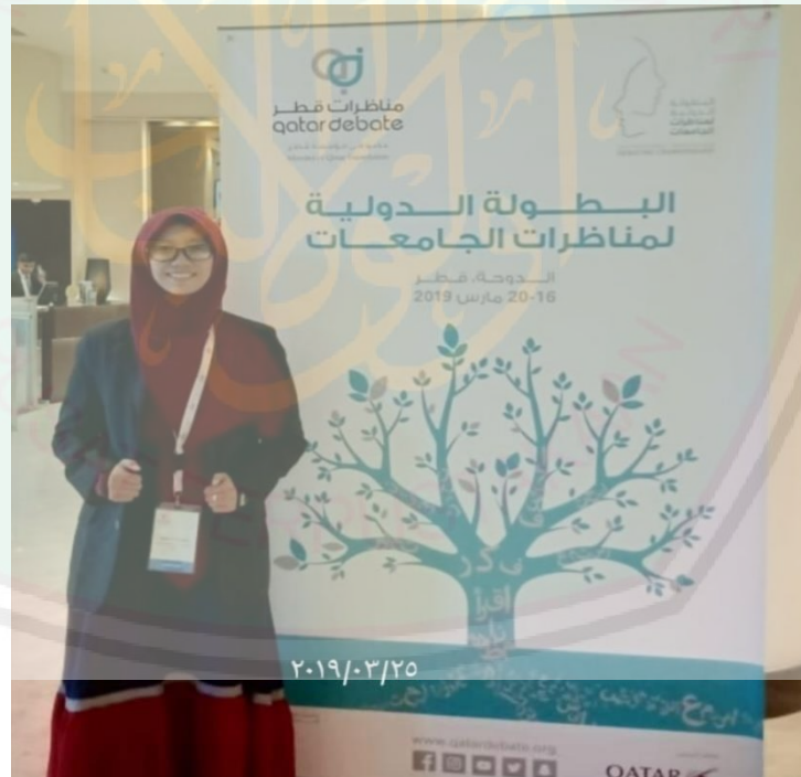
صورة ٧ : مندوبة مناظرة قطر ٢٠١٩