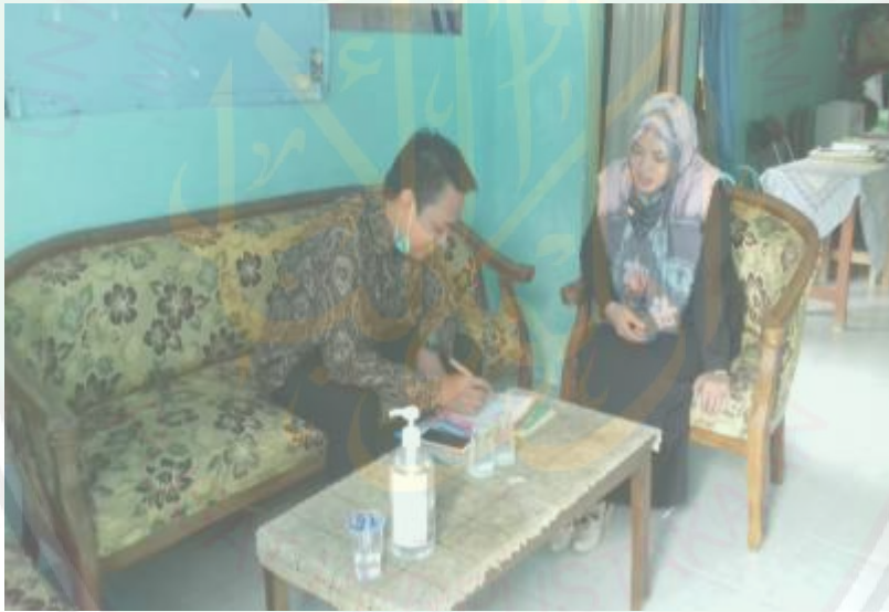
مقابلة مع معلم اللغة العربية