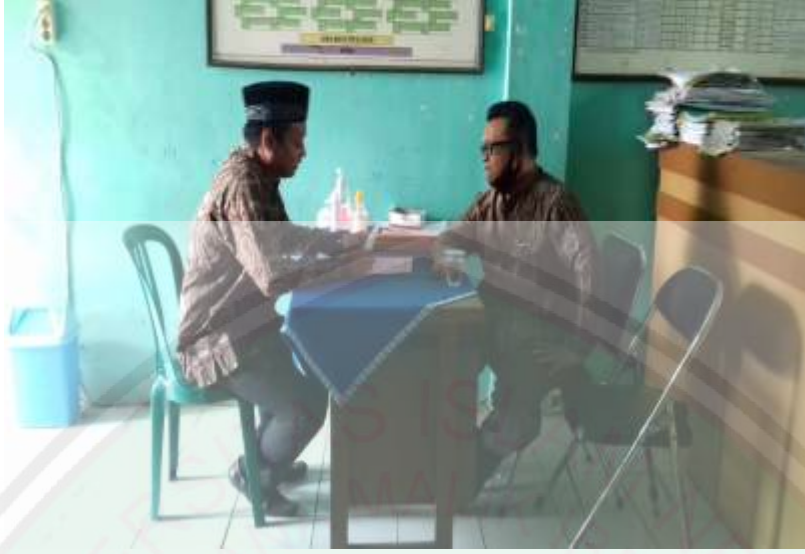
مقابلة مع رئيس المدرسة