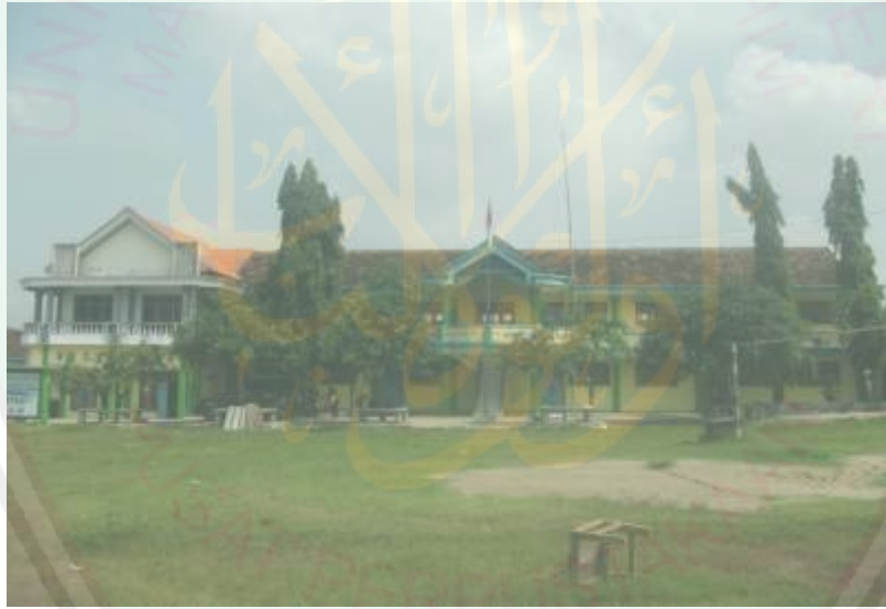
صورة مدرسة المتوسطة الإسلامية غواك مودا لامونجان