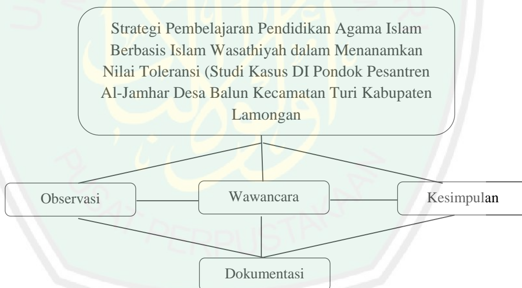
Gambar 3.1 Skema Fokus Penelitian

Teknik pengumpulan data adalah cara atau metode yang digunakan oleh peneliti dalam rangka mengumpulkan data. Jika disesuaikan dengan bentuk pendekatan penelitian kualitatif dan sumber data yang digunakan maka, teknik pengumpulan data yang akan dilakukan oleh peneliti adalah sebagai berikut :