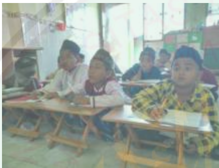
KBM kelas 2 Ulaa (2019)