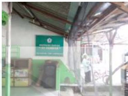
Kantor Diniyah Al-Jamhar