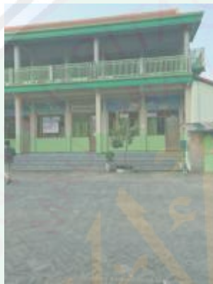
Gedung RA & ruang kelas Diniyah