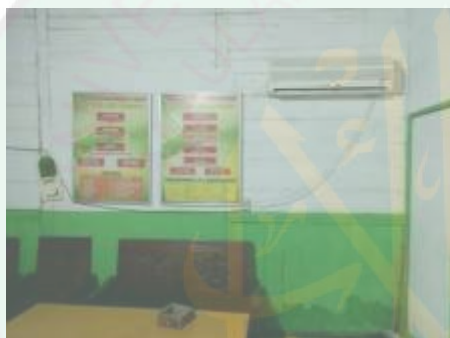
Kantin Pondok Pesantren Al-Jamhar