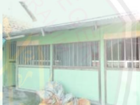
Koperasi Pondok Pesantren Al-Jamhar