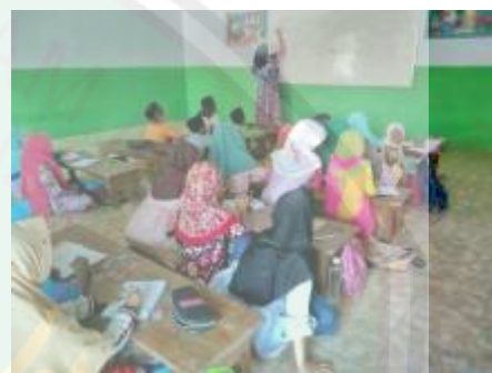
KBM kelas 3 Ulaa (2019)