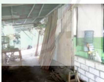
Usaha Potong Kayu Ponpes Al-Jamhar