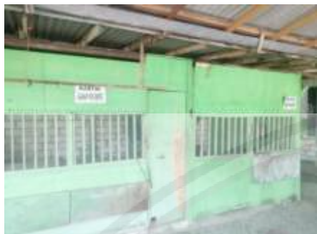
Kantin Pondok Pesantren Al-Jamhar