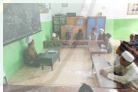
KBM kelas 1 Wusta