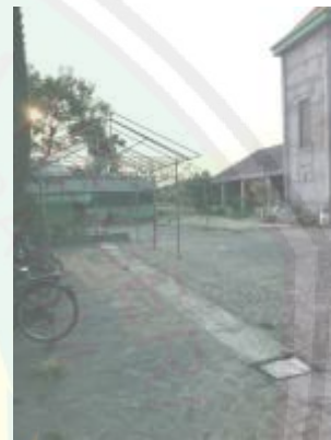
Halaman Pon Pes AL-Jamhar