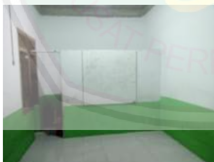
Ruang Kelas I Ulaa