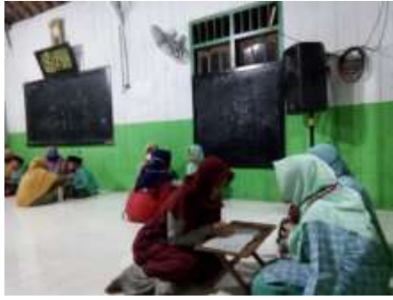
UTK Bi Al-Nadzar