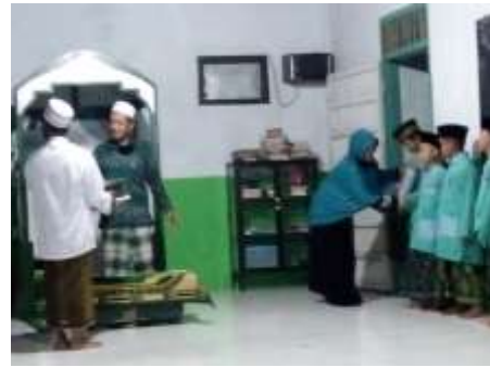
Prosesi Pemberian Ijazah