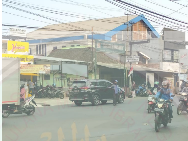
Foto Praktik Pengaturan Jalan oleh Sukarelawan Pengatur Lalu-lintas (SUPELTAS) di persimpangan jalan daerah kecamatan Sukun (diambil tgl 3 September 2020)