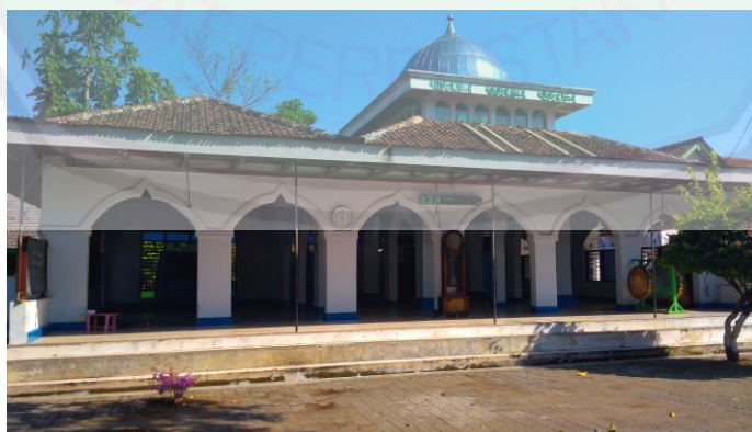
Foto 3. Pondok Pesantren At-Tahdzib, Jombang