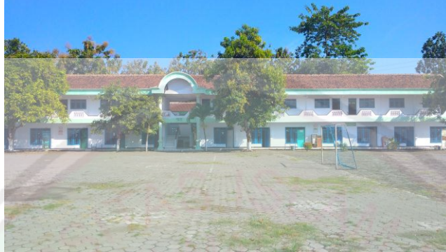
Foto 1. Pondok Pesantren At-Tahdzi, Jombang

Bangunan tersebut menunjukkan kamar santri di lantai 1, sedangkan di lantai 2 merupakan ruang kelas putra