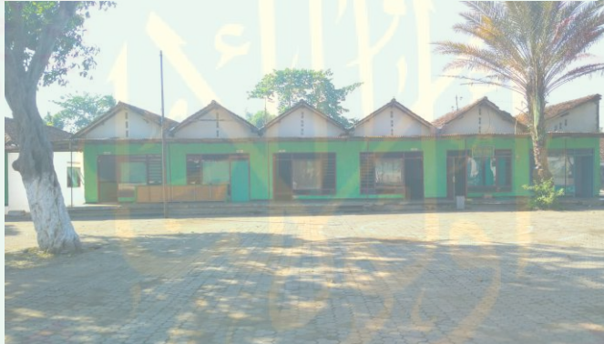
Foto 2. Pondok Pesantren At-Tahdzib, Jombang

Bangunan tersebut menunjukkan kamar santri di lantai 1, sedangkan di lantai 2 merupakan ruang kelas putra