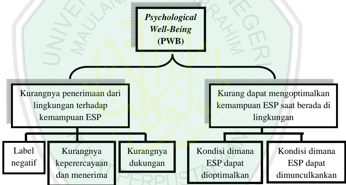
Bagan 4.3. Faktor yang Memengaruhi PWB pada Individu yang Memiliki ESP