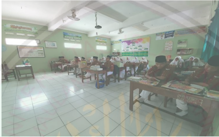
صورة ١: الأنشطة التعليمية