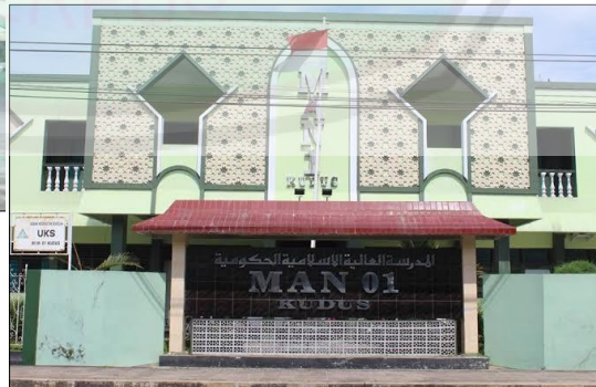
صورة ٢: المباني المدرسة