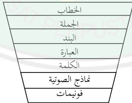
رسم بياني ١: التسلسل الهرمي للغة

من ناحية أخرى، يقول Kridalaksana (١٩٨٤) و HG Tarigan (١٩٨٧) و Hasan Lubis (١٩٩١) و Djajasudarma (٢٠١٢) أنّ الخطاب يحتل أعلى و أكمل موقع في التسلسل الهرمي للغة لأنّه يشمل جميع الوحدات النحوية و العناصر اللغوية الدلالية وغيرها، نحو الجمل والعبارات و الكلمات و النماذج الصوتية و الفونيمات (Mulyana، ٢٠٠٥، ص.٦). وصف Mulyana موقف الخطاب في التسلسل الهرمي للغة على النحو التالي.