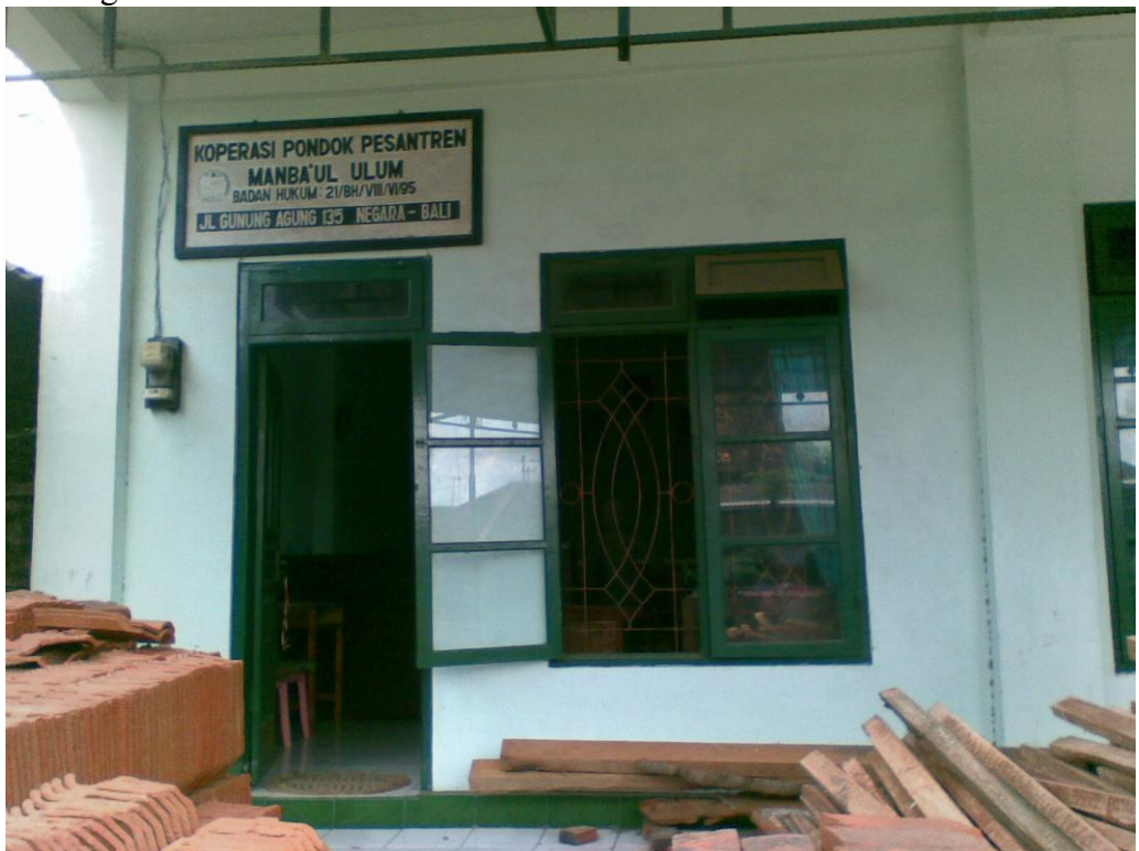
Posisi Koperasi berada disebelah kanan dari gedung utama Pondok Pesantren