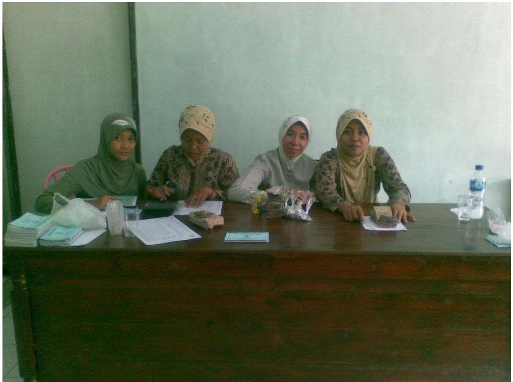
Peneliti mewawacarai bagian Pembukuan dan Staf Penagihan Koperasi