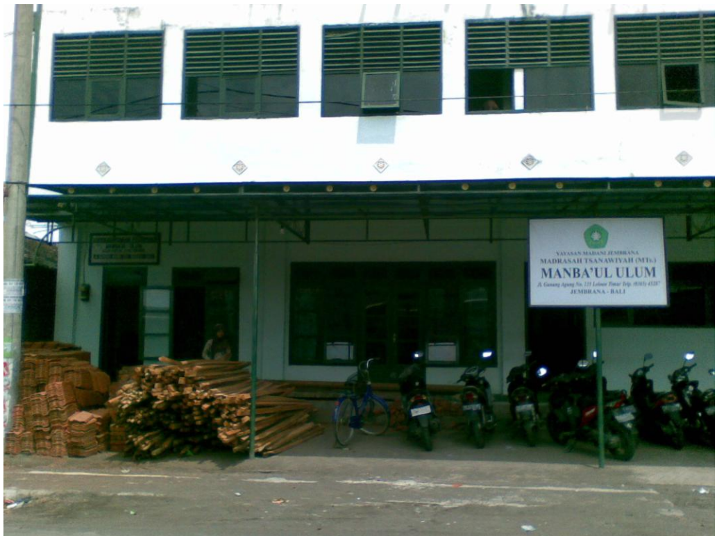
Gedung utama Pondok Pesantren Manba'ul 'Ulum