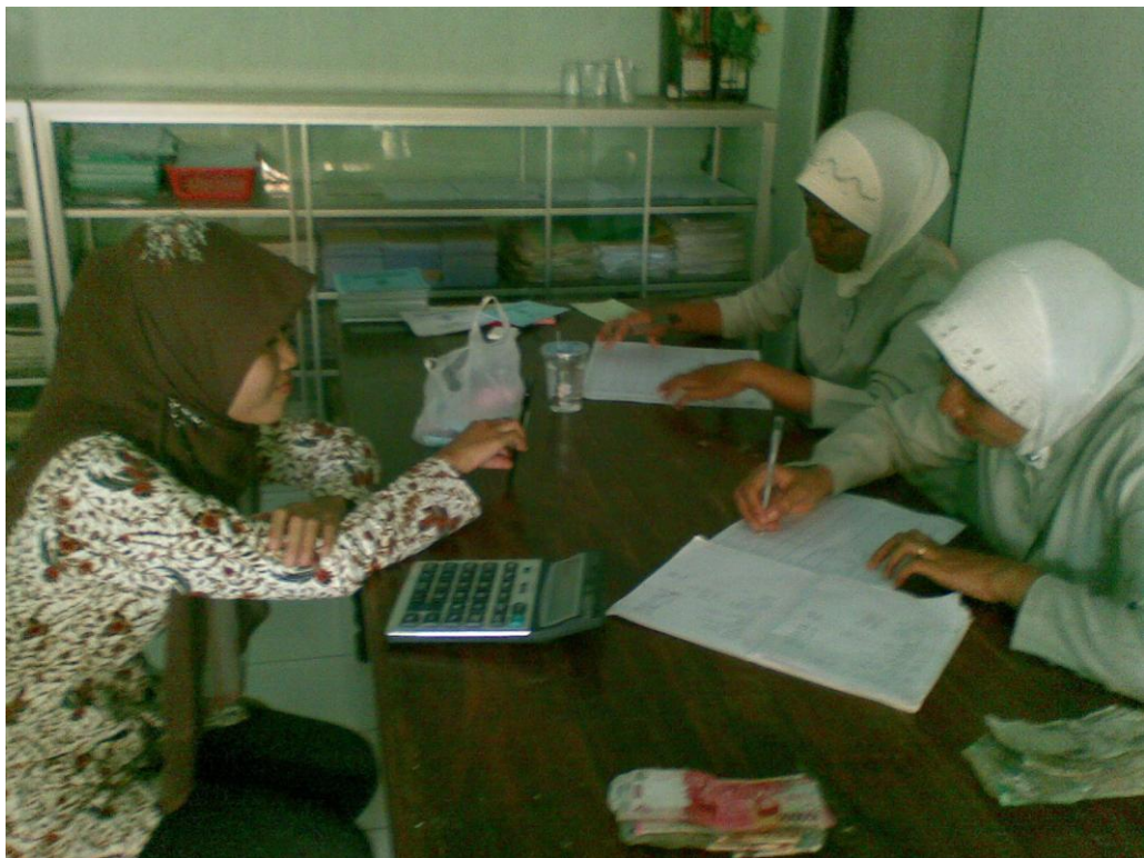
Nasabah saat melakukan transaksi dengan Staf Penagihan