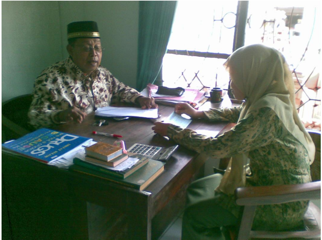
Peneliti mewawancarai Manager Koperasi Pondok Pesantren Manba'ul 'Ulum