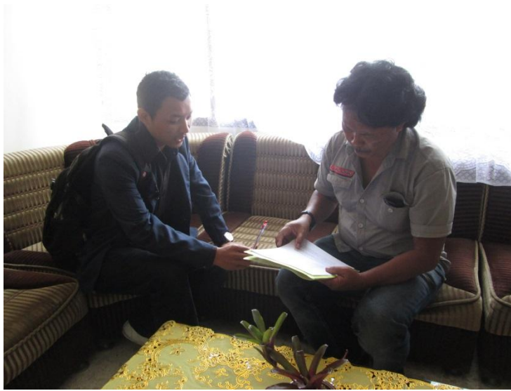
Wawancara Dengan Kepala Bagian Personalia