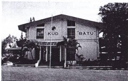
Gedung pengolahan susu KUD "BATU"