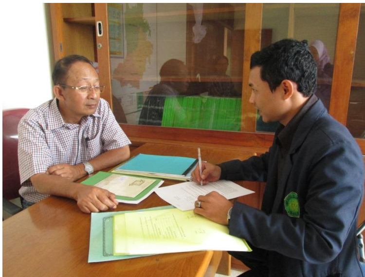
Wawancara Dengan Bagian Sekretaris