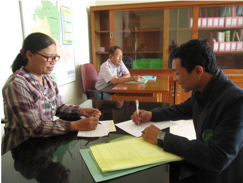
Wawancara Dengan Staff Sekretaris