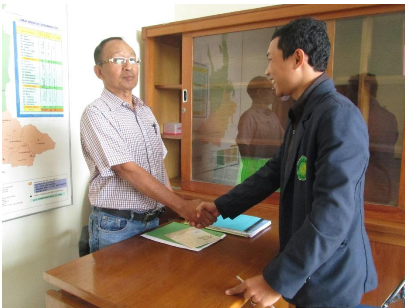
Ucapan Terima Kasih