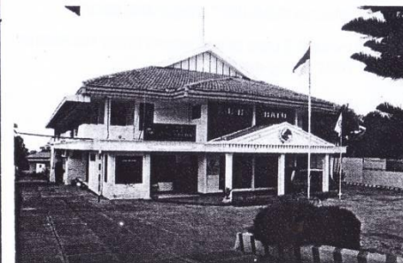
Gedung kantor KUD "BATU"

BADAN HUKUM : 518/03-PAD/422.402/2004 ALAMAT : Jl. Diponegoro 8 Batu 65314 KOTA BATU TELP. : (0341) 591869 FAX : (0341) 597143