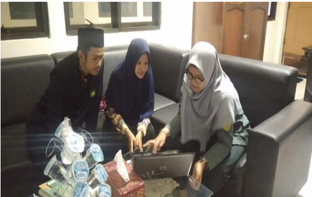
Gambar 2. Wawancara Petugas E-Court