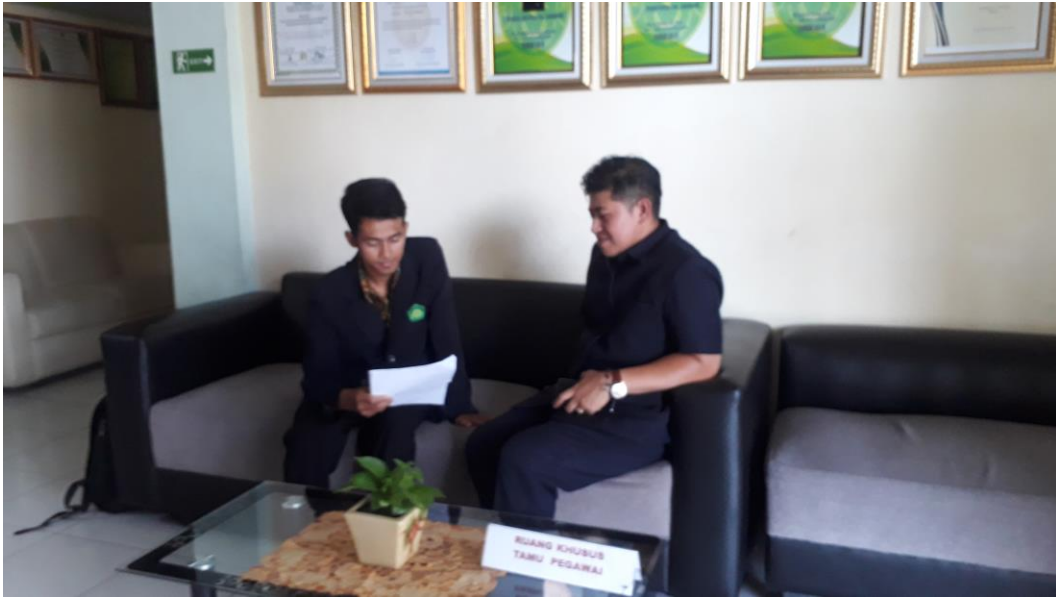
Gambar 4. Wawancara Hakim