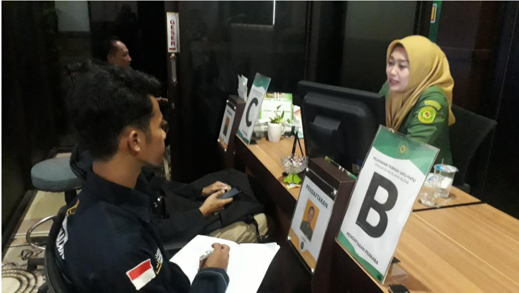
Gambar 1. Wawancara Petugas E-Court