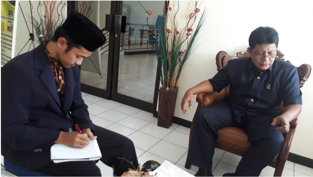
Gambar 2. Wawancara Hakim