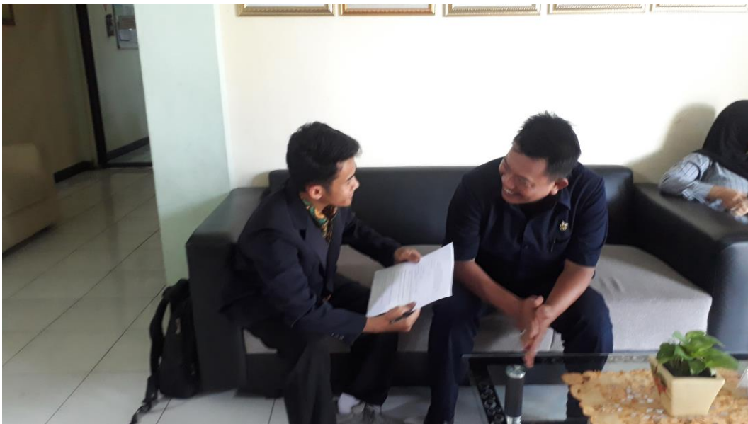
Gambar 3. Wawancara Hakim