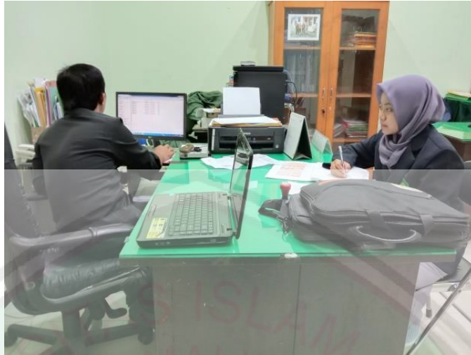
Gambar 3 (Wawancara dengan Hakim PA Banyuwangi)