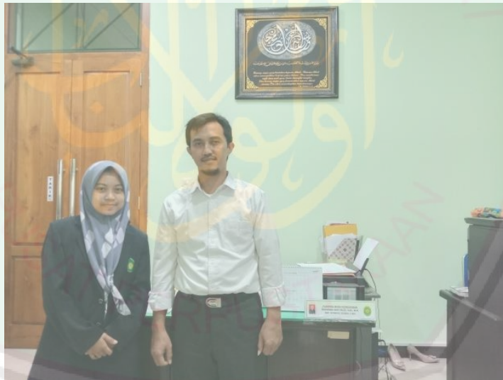
Gambar 4 (Wawancara dengan Panitera muda permohonan PA Banyuwangi)