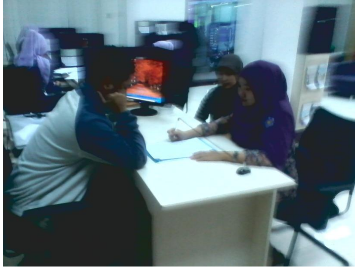
Wawancara peneliti dengan Relationship Manager Bank Muamalat Cabang Malang tentang Komunikasi Pemasaran produk KPR iB Muamalat