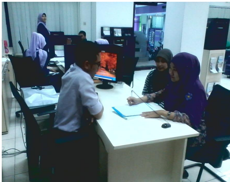
Kegiatan wawancara dengan Manager Relationship Manager