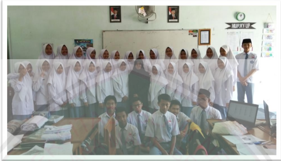
الصورة ٣: الباحثة مع طلاب الفصل الطبيعي ١