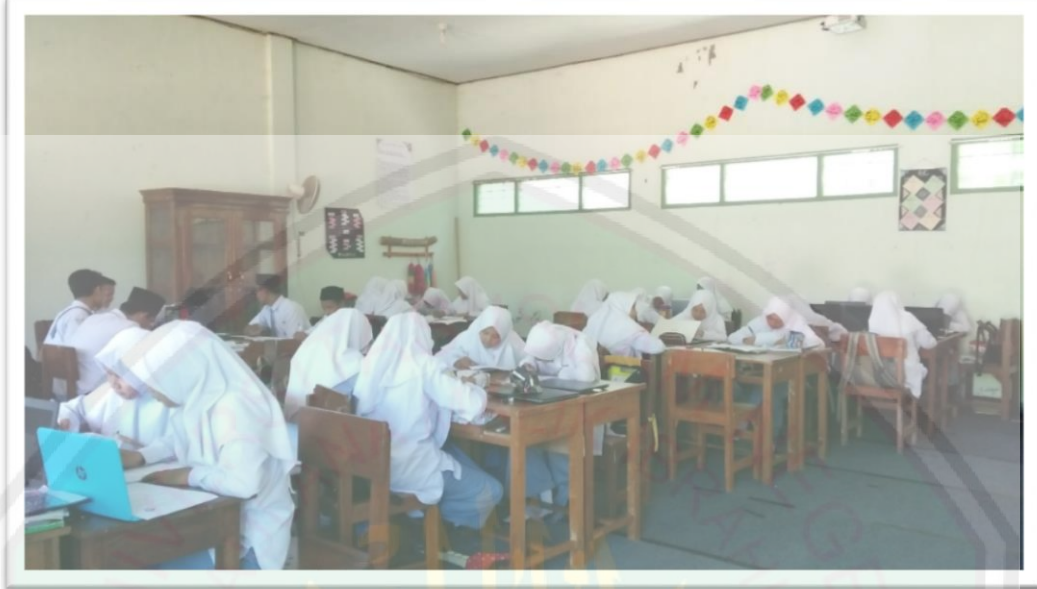
الصورة ١ : حالة الطلاب في الفصل العاشر الطبيعي ١