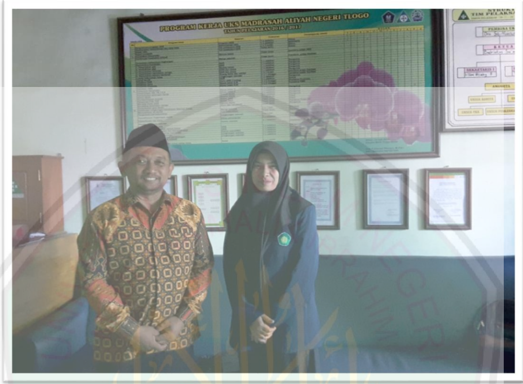
الصورة ٥: الباحثة مع مدرس اللغة العربية في الفصل العاشر