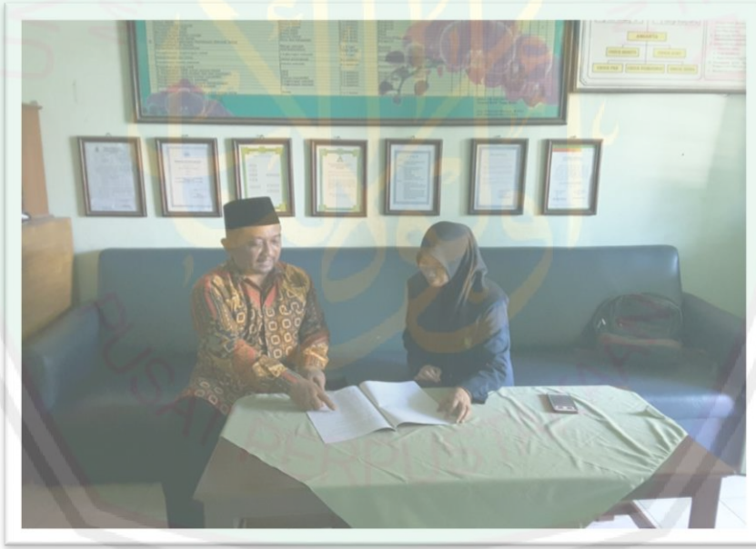
الصورة ٤: مقابلة بين الباحثة و مدرس اللغة العربية في الفصل العاشر