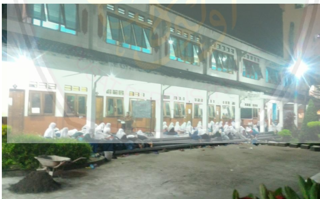
Gambar 1.7. kegiatan Madrasah Diniyah