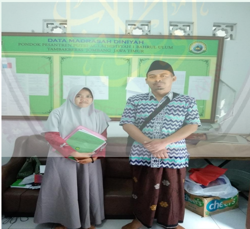
Gambar 1.5. foto bersama guru sorogan