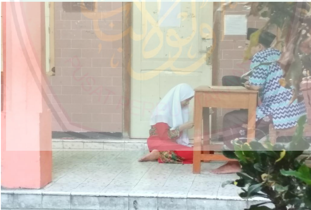
Gambar 1.3. kegiatan sistem sorogan