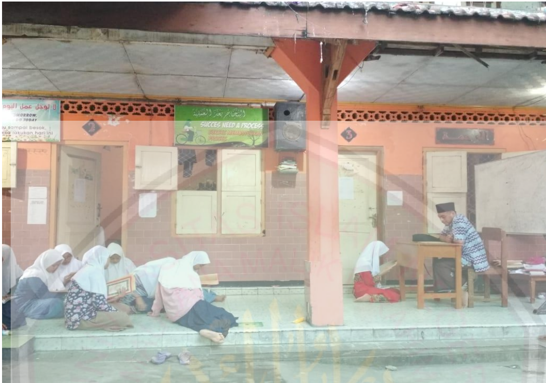
Gambar 1.2. kegiatan sistem sorogan