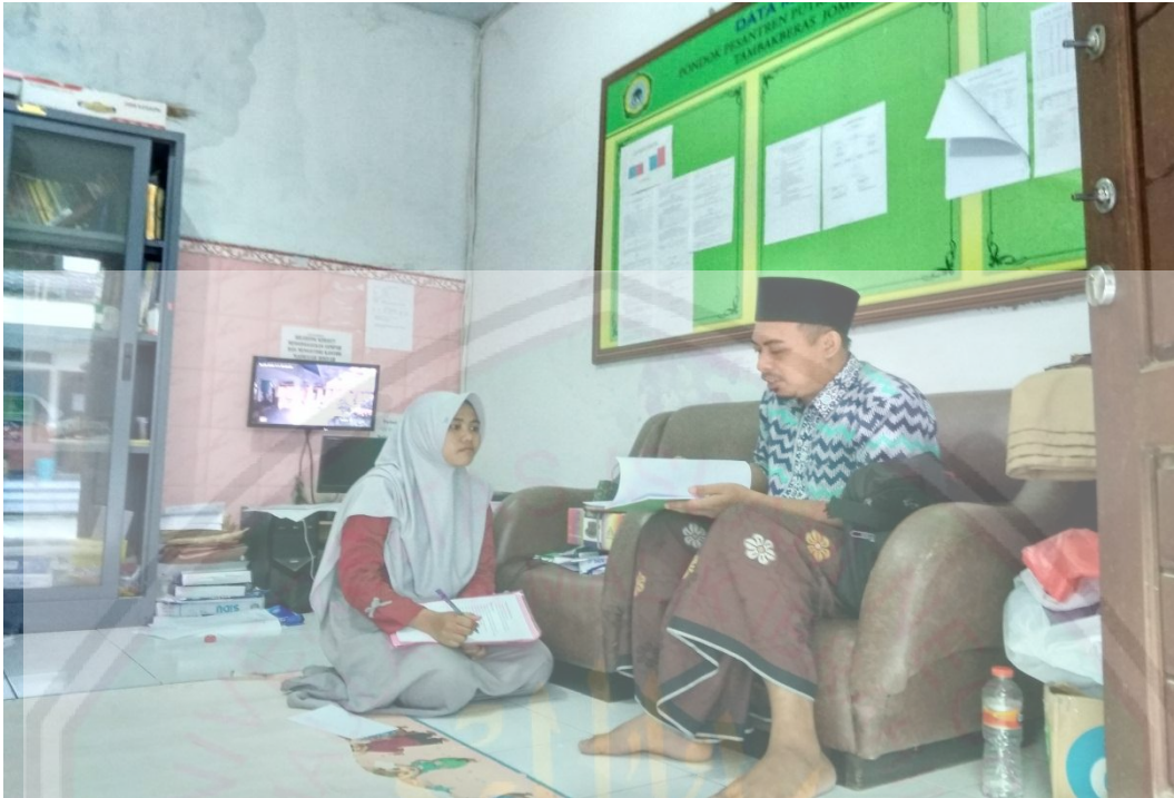
Gambar 1.4. wawancara bersama salah satu guru sorogan