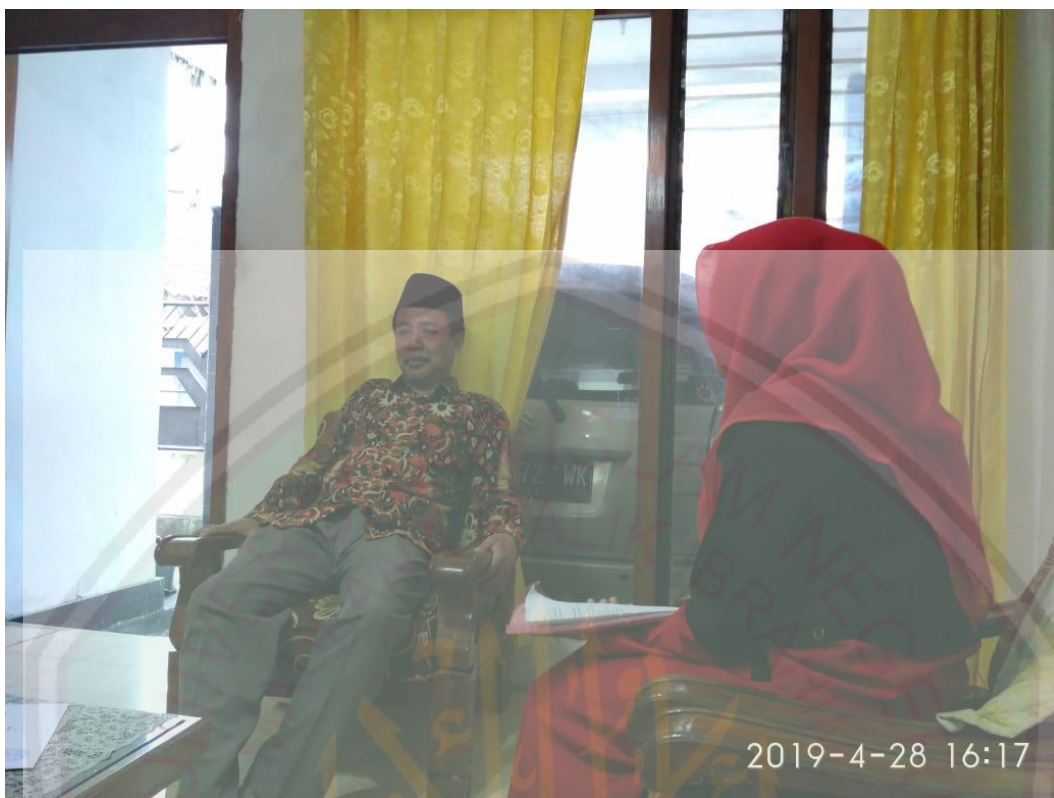
Gambar 1.6. wawancara bersama kepala sekolah