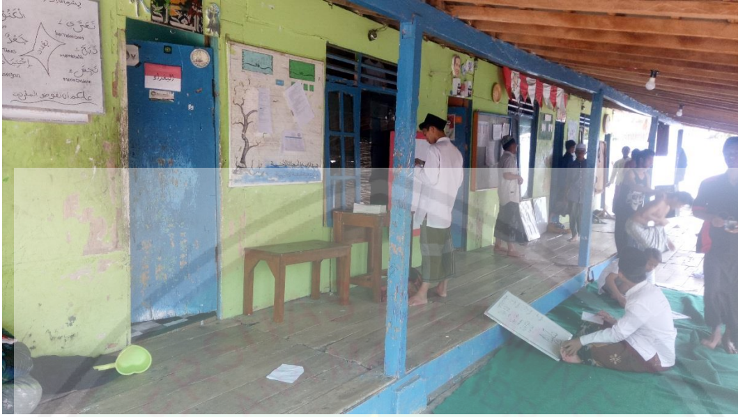
السكن للبنين في مركز ترقية اللغة الأجنبية