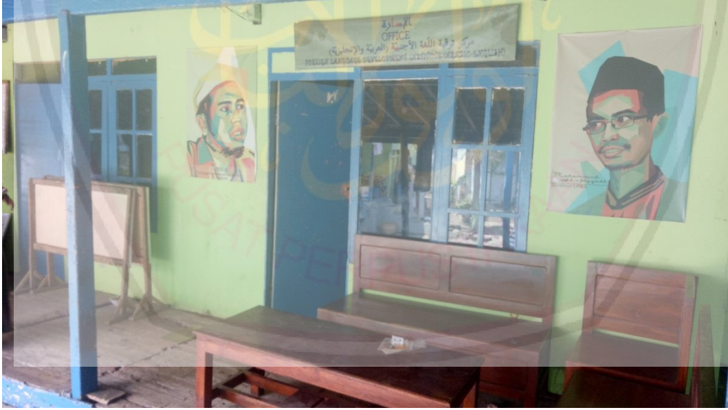
إدارة مركز ترقية اللغة الأجنبية والمكتبة