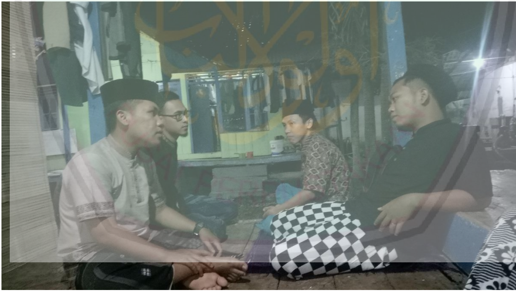
المقبلة مع نائب المدير والمعلم