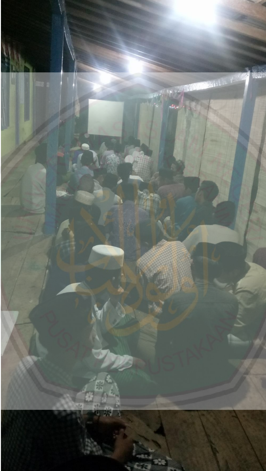
البرنامج الإضافية (ليلا)