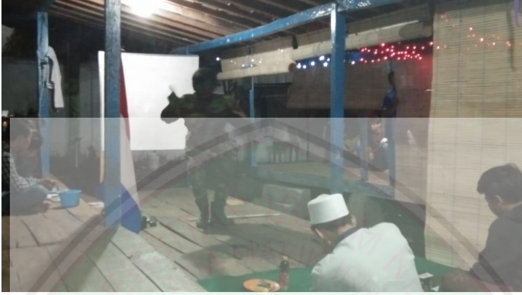
احد البرنامج الإضافي