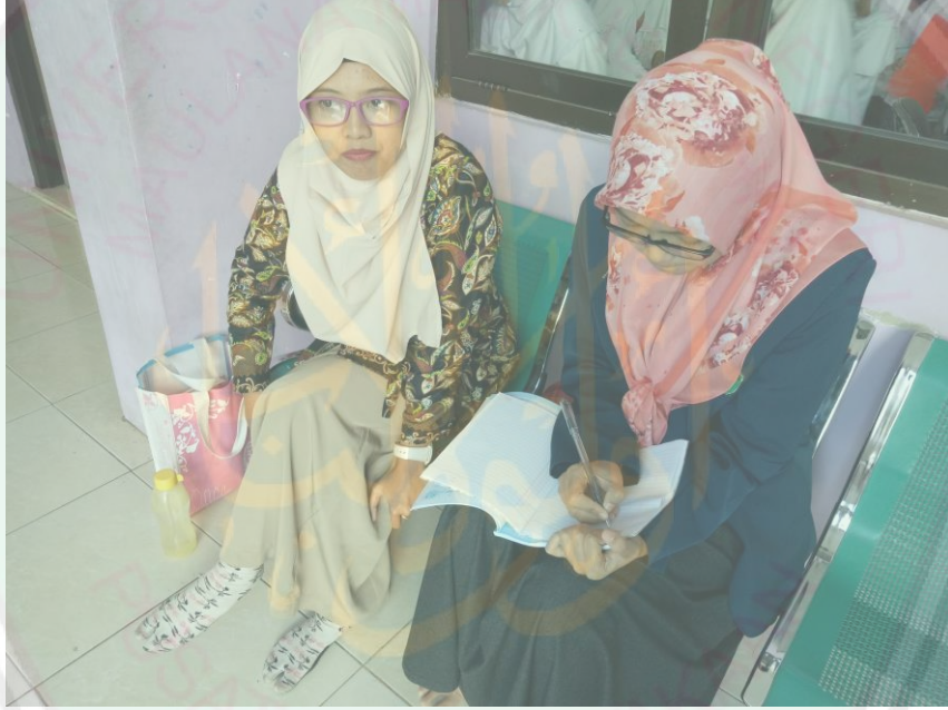
صورة ٣ (مقابلة مع مدرسة اللغة العربية)