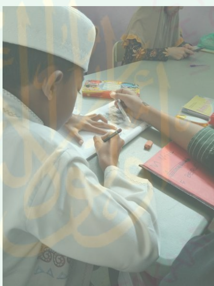
صورة ١ (عملية التعليم)