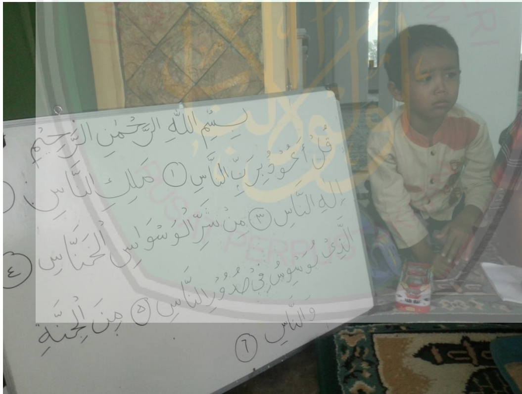
عملية التعليم في برنامج تحفيظ القرآن (في التاريخ ٢٥-٥-١٩٠٢٠ م)