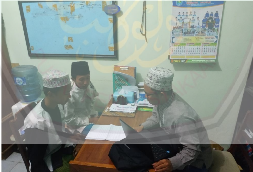
الاختبار في قراءة القرآن وقراءة النصوص العربية