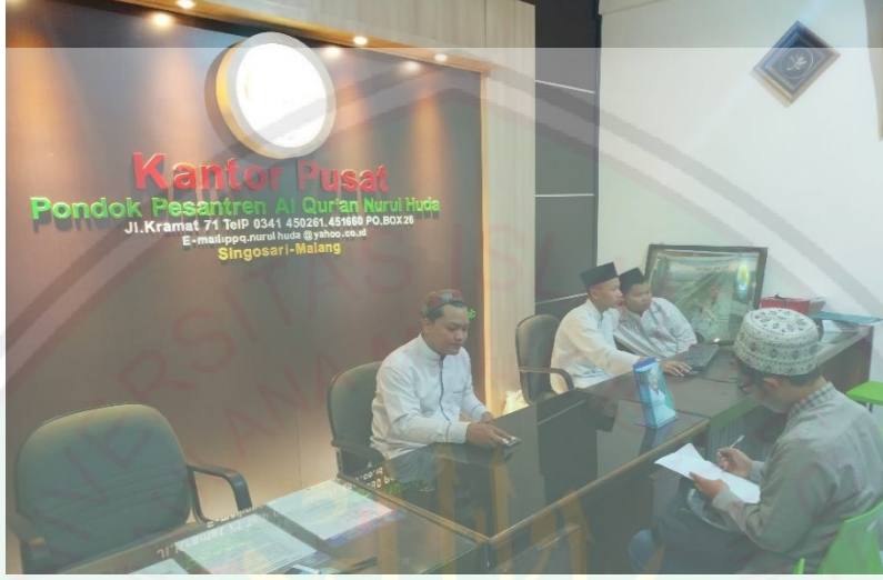
المقابلة مع أستاذ المدرسة الدينية