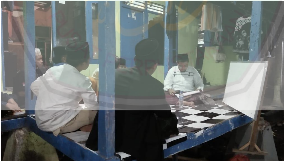
تعليم مهارة الكتابة

د. طريقة المستخدمة في تعليم مهارة الكتابة