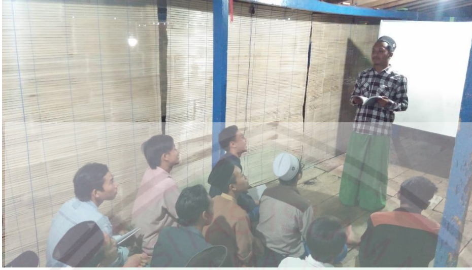
تعليم مهارة القراءة