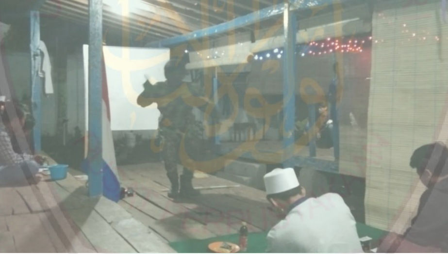
تعليم مهارة الكلام