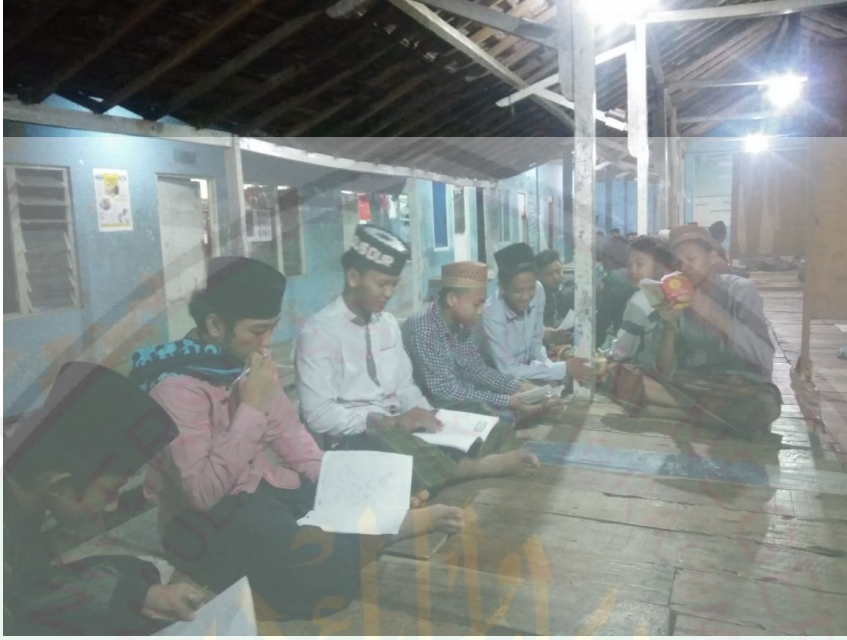
تعليم مادة النحو

إن الطريقة المستخدمة في تعليم النحو لدي الطلاب في مركز ترقية اللغة العربية بمعهد نور الجديد هي الطريقة القياسية. لأن تعليم النحو في هذا المعهد يبدأ بعرض القاعدة النحوية ثم بتقديم الأمثلة والشواهد لتوضيحها. عند الباحث الطريقة القياسية هي الطريقة المعينة ليسر في تعليم النحو.