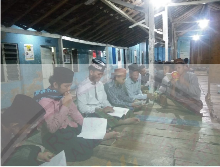
تعليم مادة النحو