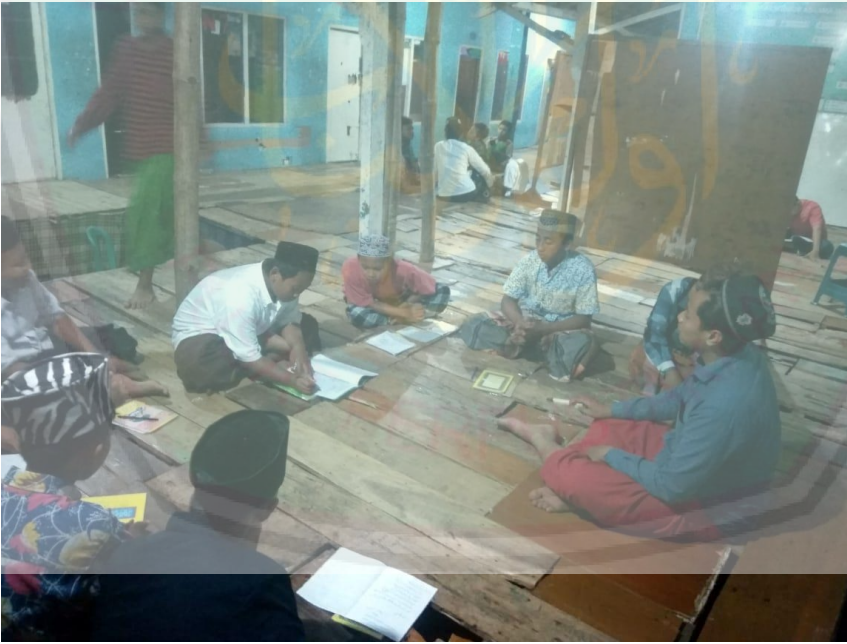
تعليم مادة الصرف