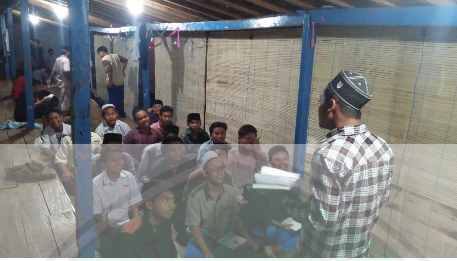
تعليم مهارة الاستماع