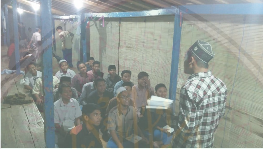
تعليم مهارة الاستماع

هذه الطريقة نظرا الى أحوال و كفاءة الطلاب في الفصل لفعالية إجراء التعليم المتخصص لمهارة الاستماع حيث كانت كفاءتهم ورغبتهم مختلفة.