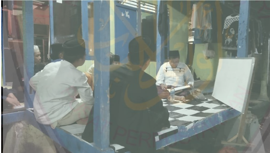
تعليم مهارة الكتابة