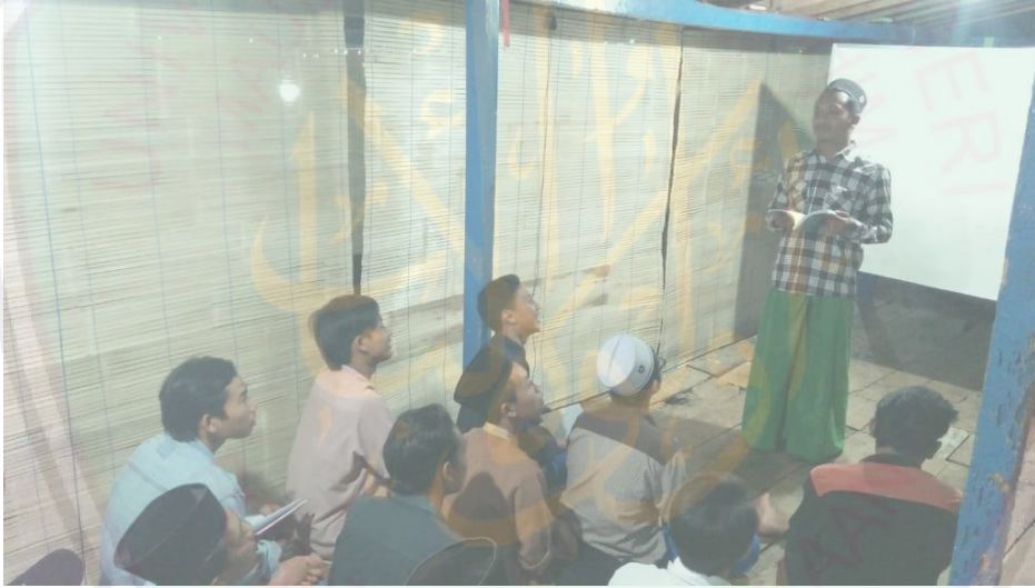
تعليم مهارة القراءة