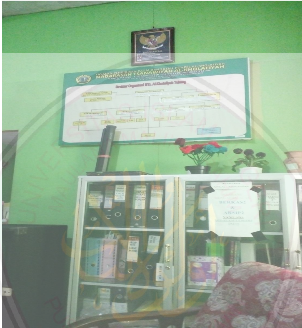
إدارة رئيس المدرسة