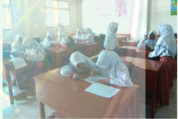
التدريبات على المفردات