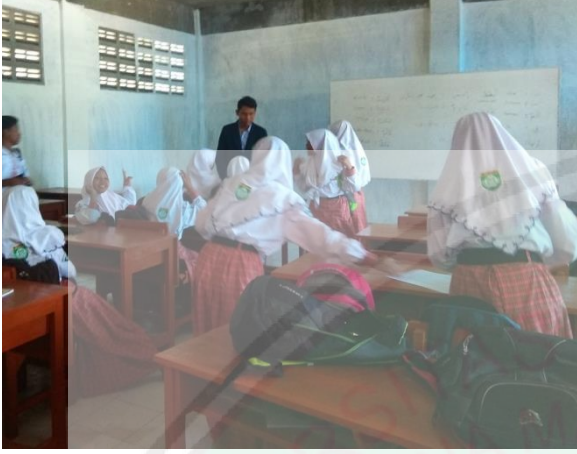
تعليم مهارة الكلام بتطبيق التمثيل الإيمائية