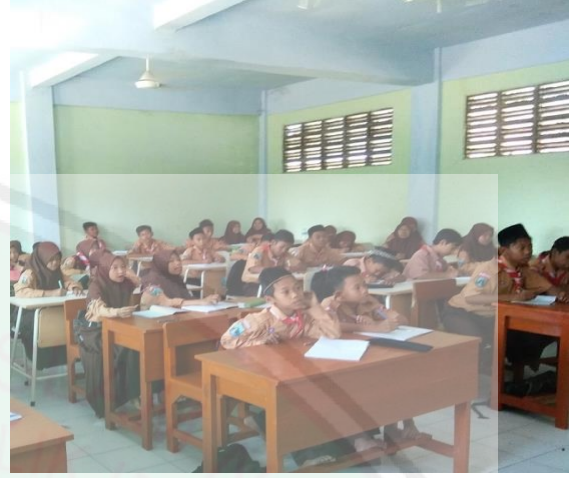
تعليم مهارة الكلام في ال للمجموعة الضابطة