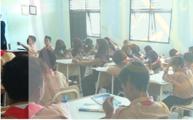
تعليم مهارة الكلام في الفصل للمجموعة التجريبية