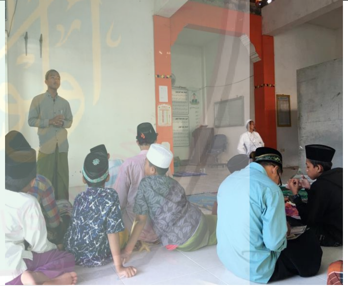
تعليم كتاب الكيلاني العزي (علم الصرف)