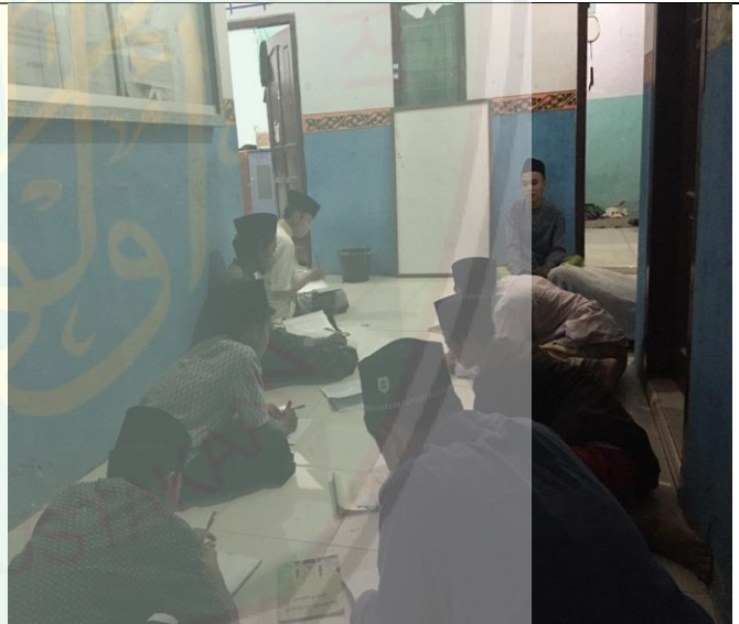
تعليم مهارة الكتابة للمتوسطين