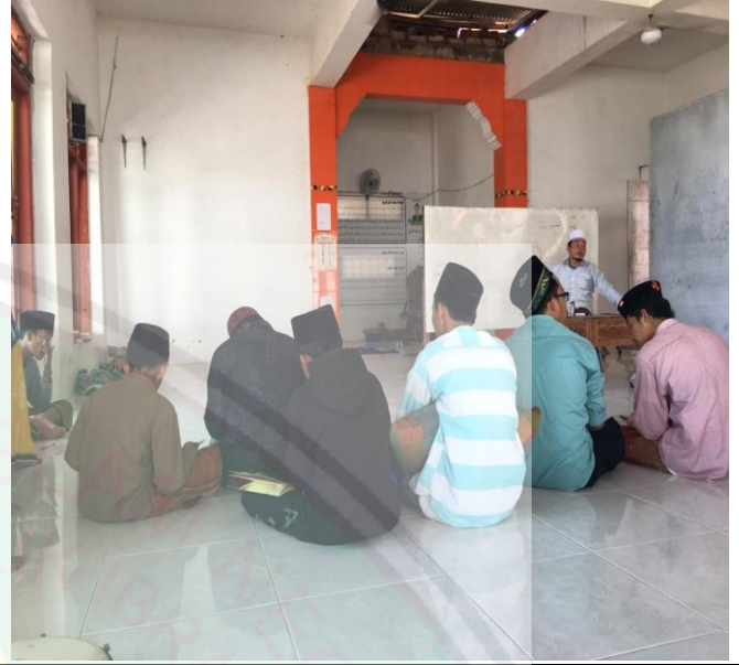
تعليم كتب التراث