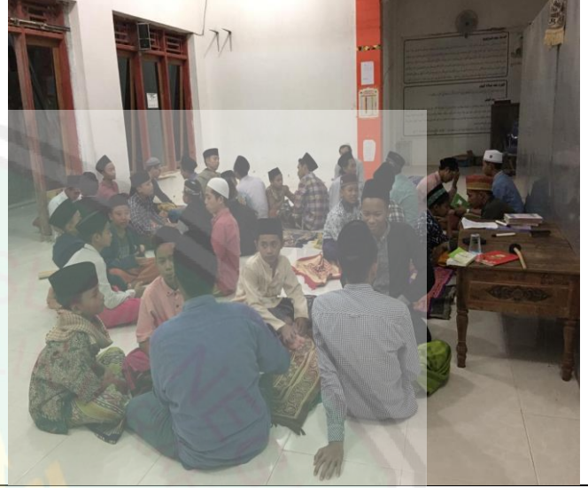
نشاط المحادثة بعد كل صلوات الجماعة