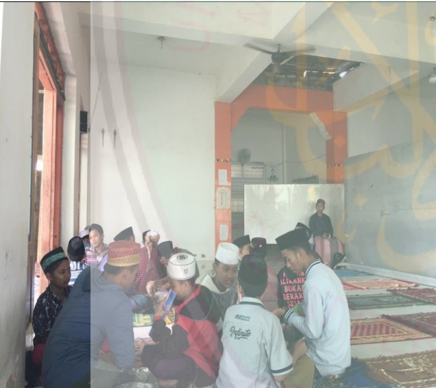
تعليم مهارة الكلام