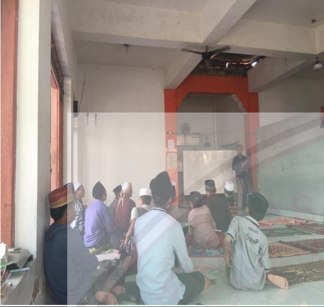
تعليم القواعد النحوية والصرفية