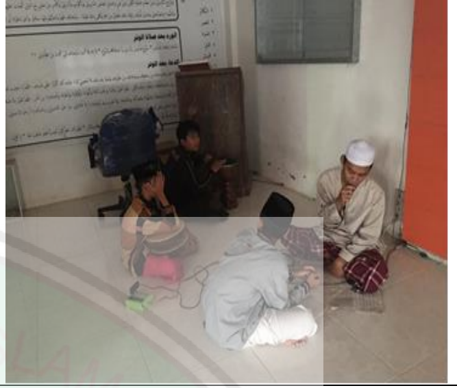
نشاط تكرير أمثلة الصرف بالغناء