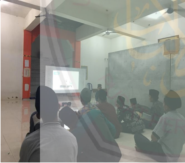
تعليم مهارة الاستماع للمتقدمين