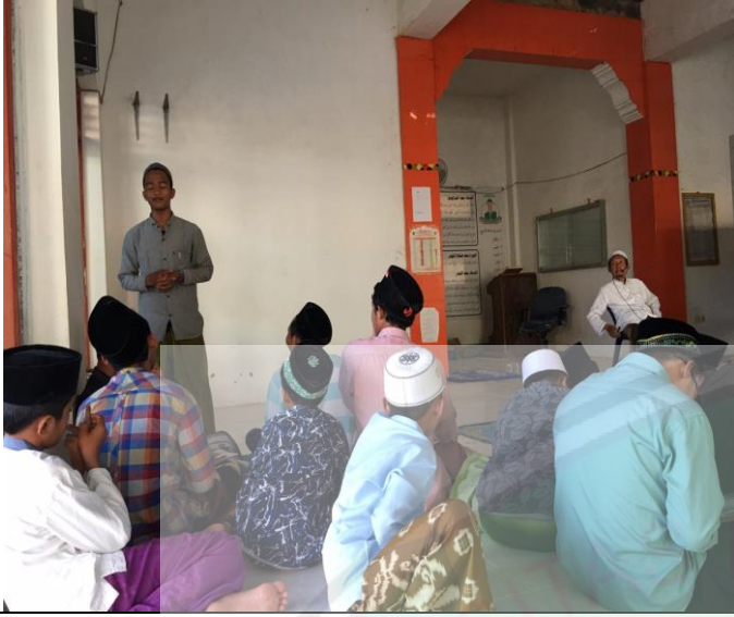
تعليم مهارة الكلام