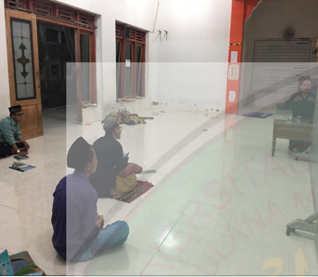
تعليم الأفكار الإسلامية للمتقدمين